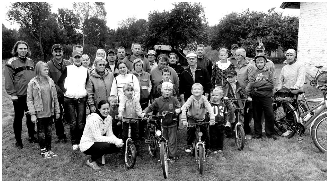
Velobraucienā «Pretī rudenim» piedalījās vairāk nekā 30 interesentu gan no Vecumnieku, gan kaimiņu novadiem.