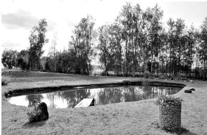
Bērzu ielas 11. nama saimnieku iekārtotā atpūtas vieta sagādā prieku pašiem un dara pievilcīgākus arī Stelpes «vaibstus».