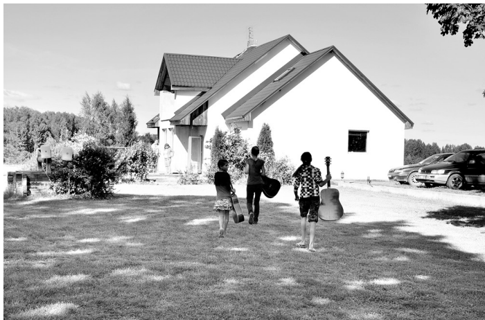
«Jaunlādzēnos» pulcējas gan vietējie, gan ārzemju jaunieši, kuri Stelpē veic brīvprātīgo darbu.