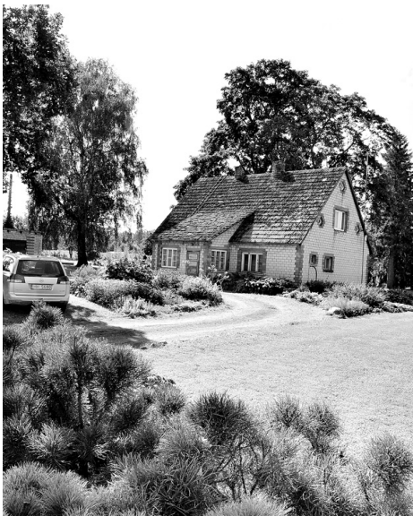
«Līvu» ļaudis prot gan veiksmīgi saimniekot, gan turēt skaistu savu sētu.