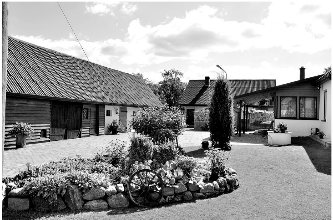
Stāvot «Sūnu» pagalmā, ir grūti iztēloties, kā lauku sētā iespējams nodrošināt tik perfektu kārtību.

Stelpieši ir aktīvi Eiropas Savienības struktūrfondu līdzekļu piesaistītāji dažādu projektu īstenošanā. Šogad iegūts finansējums nodegušā tautas nama pamatu nostiprināšanai un 2010. gadā uzbūvētās estrādes apkārtnes apzaļumošanai un labiekārtošanai, kā arī bērnu rotaļu laukuma ierīkošanai pie daudzdzīvokļu mājām Nizerē. Iedzīvotāji labprāt iesaistās vides sakopšanas talkās, pārvalde gādā par kārtību pagasta teritorijā, kapsētās un Brāļu kapos.