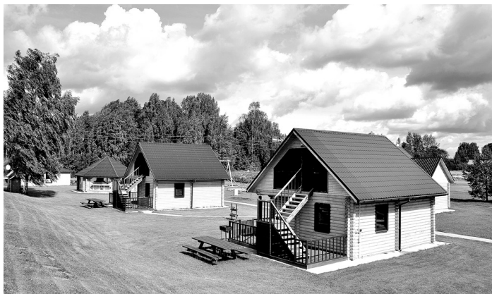
Lauku tūrisma un atpūtas parka «Makšķernieku paradīze» namiņos vienlaikus var apmesties 65 viesi.