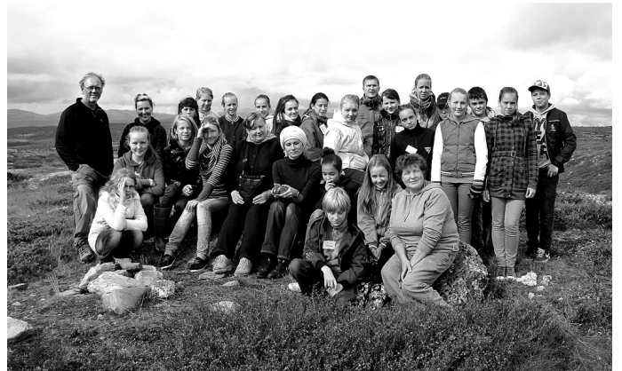
Hammāras dabas skolas dalībnieki no Latvijas – Vijoļu kalnos.

Bija interesanti vērot un klausīties stāstījumu par lauksaimniecības attīstības iespējām šajā valstī. Secinājums – norvēģi ir ļoti strādīgi un godīga tauta. Par to pārliecinājāmies arī paši. Visas mūsu mantas atradās neaizslēgtos namiņos, braucot ar laivām, naudu, dokumentus, virsdrēbes atstājām upes malā un, kad atgriezāmies, viss bija savās vietās. Droši