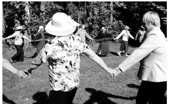
Eiropas deju kolektīvs (dāmas ar cepurēm) no Ķekavas novada Baložiem rotaļās iesaistīja visus pasākuma dalībniekus.