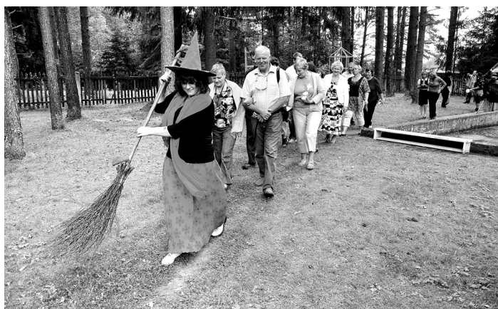
Ceļu uz Taurkalnes bibliotēku vērtēšanas komisijas pārstāvjiem slauka raganiņa.

Pateicoties SIA «Agronika» atbalstam, pārvērtības piedzīvojis Valles vidusskolas ģeogrāfijas un bioloģijas kabinets. Šo-