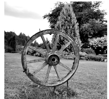
Ratu riteni ir Staru māju «rozīnīte».