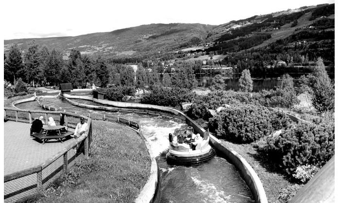
Aizraujošs bija brauciens pa kalnu upi Troļļu parkā Lillehammerē.

vien arī godīgums sekmē valsts attīstību un labklājību.