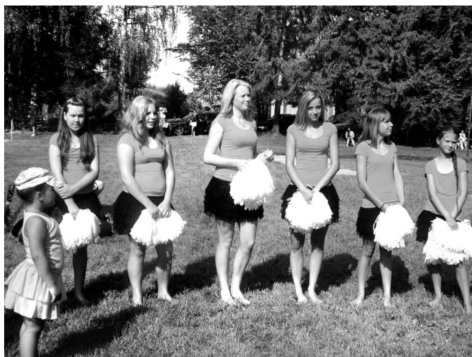
Uznācienam gatavojas Kurmenes karsējmeitenes.