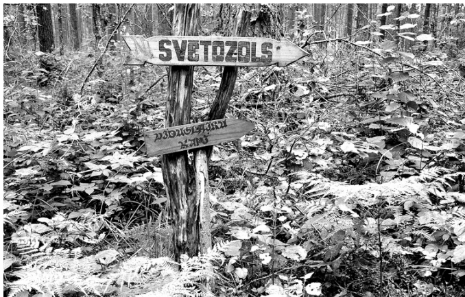
Senvietā var nokļūt, sekojot ceļa norādei.

Jau sesto rudeni Ķuņķu svētozols Stelpes pagastā aicina kopā pulcēties ļaudis, kuri grib izjust pagātnes elpu.