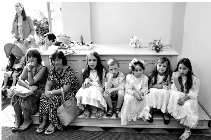
Saposti baltās drānās mazie skaistkalnieši baznīcā gaida mirkli, kad viņi tiks aicināti piedalīties procesijā.