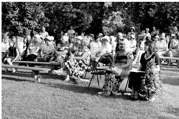
«Zvanītāju Buku» dārzā pulcējās Latvijas Nacionālā teātra ļaudis, vallieši un viesi.