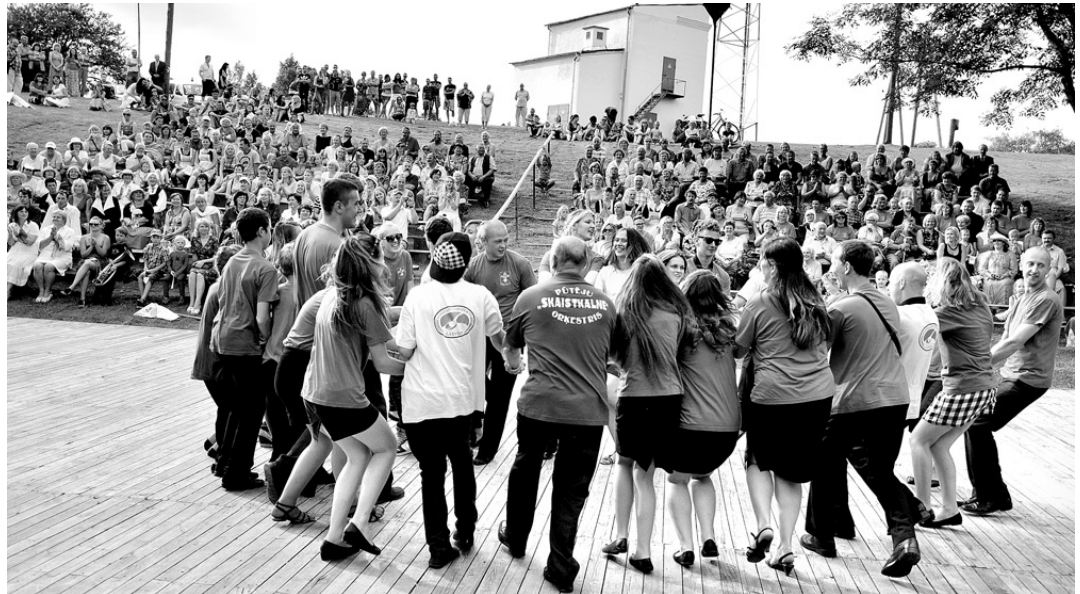
Pūtēju orķestra «Skaistkalne» jaunieši prot gan taures pūst un bungas sist, gan uzdancot.

Pēc nokļūšanas estrādē Skaistkalnes pūtēju orķestru kustības simtgadei veltītais koncerts «Muzikanta sirds» varēja sākties. Gan esošie un bijušie skaistkalnieši, gan viesi neslēpa prieku par muzikālajiem bērniem un jauniešiem, kuriem savas prasmes un mūzikas mīlestību ir