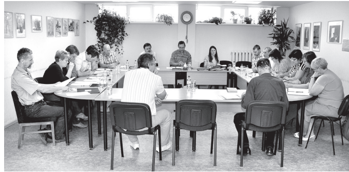
Domes sēdē 25. jūlijā piedalījās visi deputāti.

Nolemts atsavināt Vecumnieku novada Domes Skaistkalnes vidusskolas bilanci esošo traktoru T-40, pārdo dot to