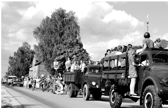
Gājiens cauri Skaistkalnei – nu gluži kā dienās tajās . Bija gan zirga pajūgs, gan javiņa ar blakusvāģi un mopēds, bet muzikanti brauca Biržu motormuzejam piederošo automobiļu kravas kastēs.