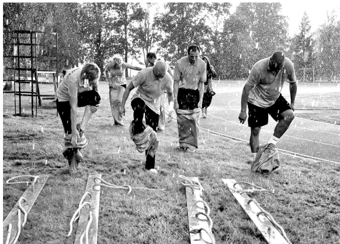
Jautrības stafete patiešām bija jautra, jo lietus visus izmērcēja līdz kaulam.