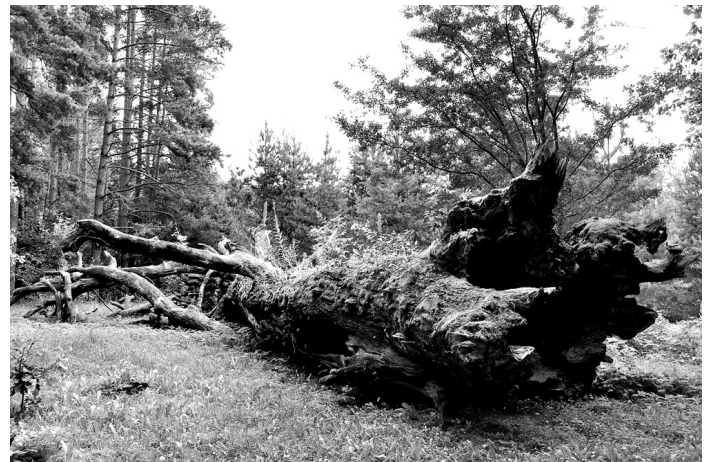
Stelpes pagastā atrodas īpašs dabas objekts – Ķuņķu svētozols, kas vētras laikā pirms vairākiem gadiem tika nogāzts, – un viduslaiku kapsēta.

Viņa ar apbrīnojamu entuziasmu muzejos un arhīvos meklēja mūsu novadnieku dzimtu saknes, pētīja radu rakstus ģimenēm, kas šeit dzīvojušas cauri gadu simtiem. Izrādās, daudzu senči ir cēlušies no votiem, kuri viduslaikos dzīvoja Pleskavas ezera apkaimē. Šo mazo, čaklo tautiņu savstarpējos karos iznīcināja kaimiņu lieltautas. Saģūstītie voti 1443. gadā tika iesaistīti smagā darbā Baus-