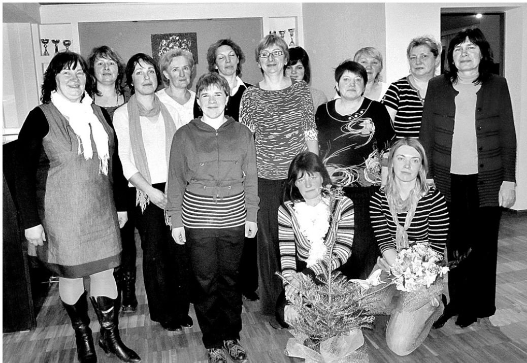
Biedrību «Mēmelīte» par savu sauc ap 20 sievu. Svētku reizē gan ne visas varēja pulcēties kopā.

Nākamo projektu – «Neturi sveci zem pūra!» – iesniedza jau sabiedriskā organizācija – Skaistkalnes lauku sieviešu klubs «Mēmelīte», kas dibināts 2002. gada 15. martā. Savukārt projekts «Pensionārs ir pilntiesīgs sabiedrības loceklis» aktivizēja pagasta senioras. Viņas vēl aizvien turpina kop-