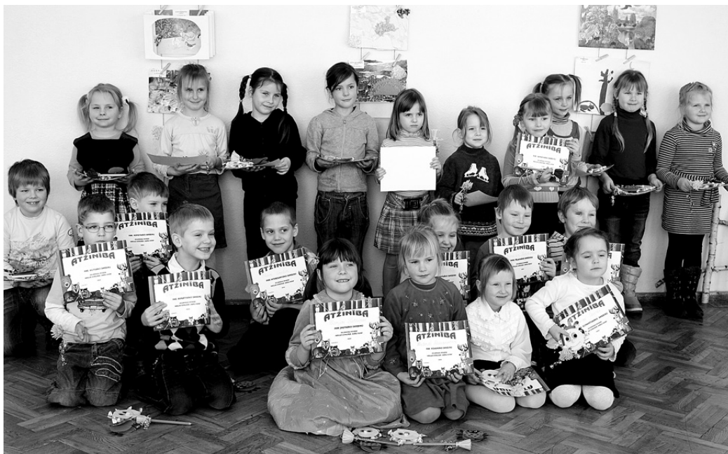
Krāsu dienas dalībnieki lepojas ar saņemto atzinību.

Kolāžu vērtēšanā iesaistījās visi līdzī atbraukušie pedagogi. Katra bērna veikums bija pelnī-