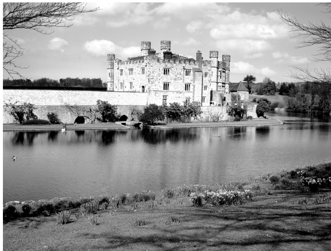
Visapmeklētākā pils Anglijā – Līdsa.

M. OZOLA, Misis vidusskolas ģeogrāfijas un angļu valodas skolotāja