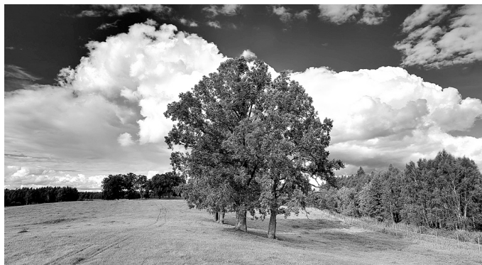
Mammās Dagmāras parka teritorija ir vairāk nekā 300 hektāru plaša, ar skaistām pļavām un vareniem ozoliem.

Jaunajā atpūtas vietā būs arī izglītojošas izstādes, dabas taka, rotaļu laukumi, zaļā kafējnīca, tiks organizēti dažādi tematiskie pasākumi. Nākotnē plānota arī viesnīca un bērnu nometņu organizēšana.