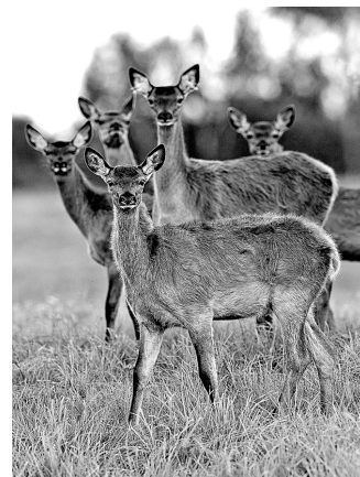
Graciozi un teju vai sinhroni briežu govīs vēro viesus.

Ir pārliecība, ka Mammās Dagmāras parks kļūs par interesantu atpūtas vietu, jo pagājušā gada rudenī, uzņemot ciemos Vecumnieku vidusskolas sākumskolas audzēkņus, redzējām, ka bērniem pie mums ļoti