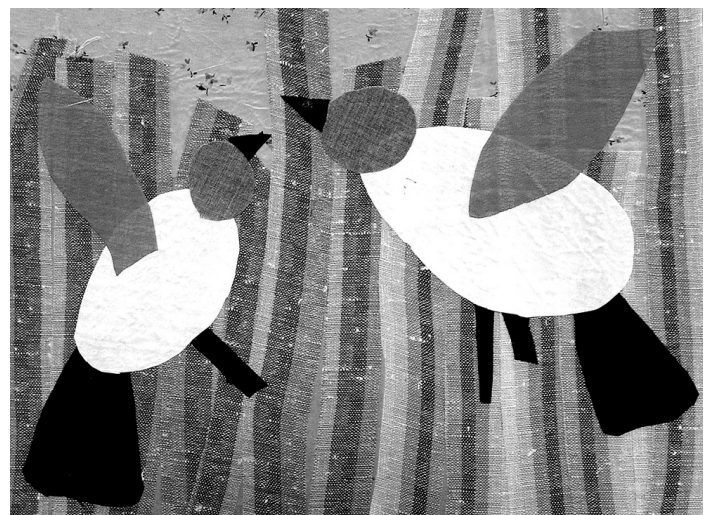
3. klases audzēkņa Kristera Čepuļa darinātā tekstilkolāža.