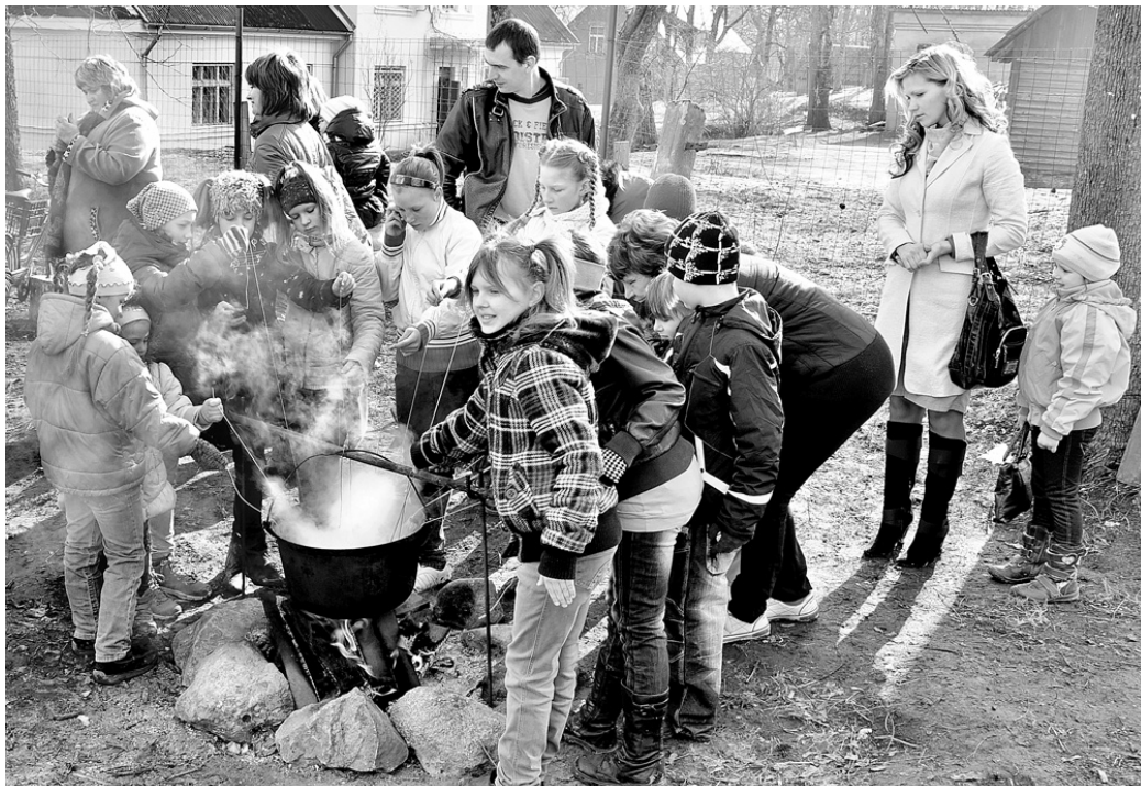
Bērniem patika olu krāsošana sīpolu mizu novārijumā, jo čaumalas kļuva košas un raibas.

Pircēji sekoja līdz svētku rosībai un pētīja tirgotāju piedāvāto preci. Interese bija par sīpolu mizām, dārzeniem, gaļas kūpinājumiem un zivju izstrādājumiem. Ļaudis pirka arī pūpolus un priecājās par zilo vizbulīšu pušķiņiem. Skaistus pinumus un māla traukus interesentiem piedāvāja biedrības «Latvijas keramika» pārstāvji,