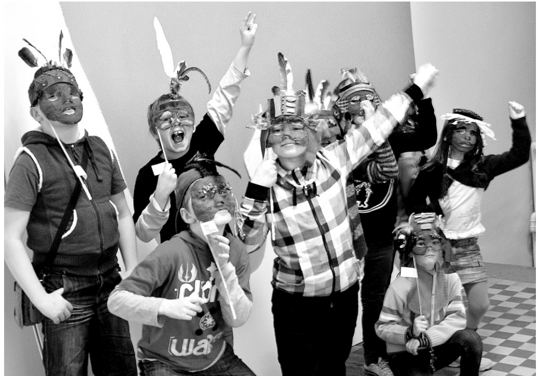
1. un 2. klases audzēkņiem piestāv indiāņu trakulības.