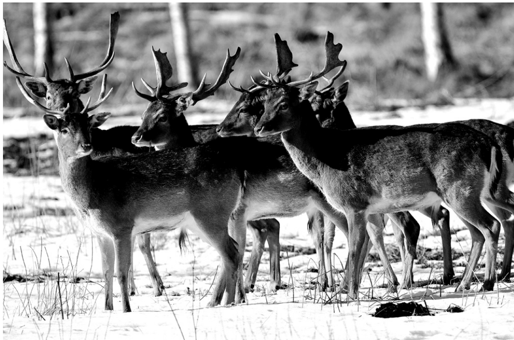
Mammās Dagmāras parkā dzīvo brieži, dambrieži un mufloni. Attēlā – dambriežu bariņš pavasarī.

Šogad Mammās Dagmāras parkā tiks uzsākta arī mini fermas iekārtošana. Tā ļaus bērniem iepazīt vistu, piļu, kazu, trušu, rukšu, zosu un citu mājputnu un mājlopu dzīvi.