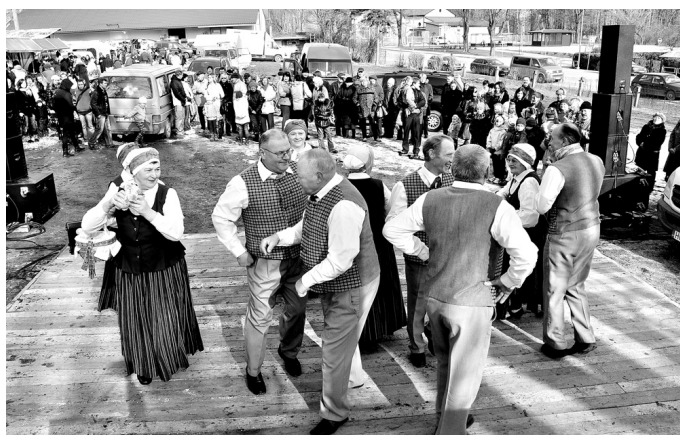
Par jautru noskaņojumu gādāja pašdarbības kolektīvi, arī senioru deju kopa «Ozols».