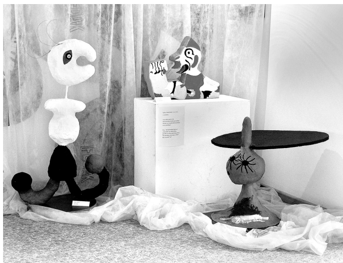
Mākslinieka H. Miro tēli 5. klases audzēkņu redzējumā.