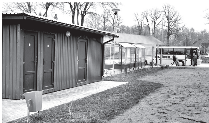
Vecumnieku centrā ir divas labiekārtotas tualetes.

Pēc projekta īstenošanas 2011. gada rudenī nepievilcīgais laukums ciema centrā pārtapa līdz nepazīšanai. Līdzās apsildāmajam kioskam tika uzlietas divas apgaismotas pieturvietas, bet tā galā, uz parka pusi, ierīkotas divas labiekārtotas tualetes. Tās apmeklētājiem ir pieejamas no februāra vidus.