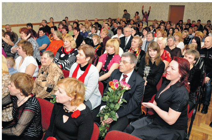
Svētku dalībnieku pulkā bija gan skaistkalnieši, gan ciemiņi no kaimiņu pagastiem.