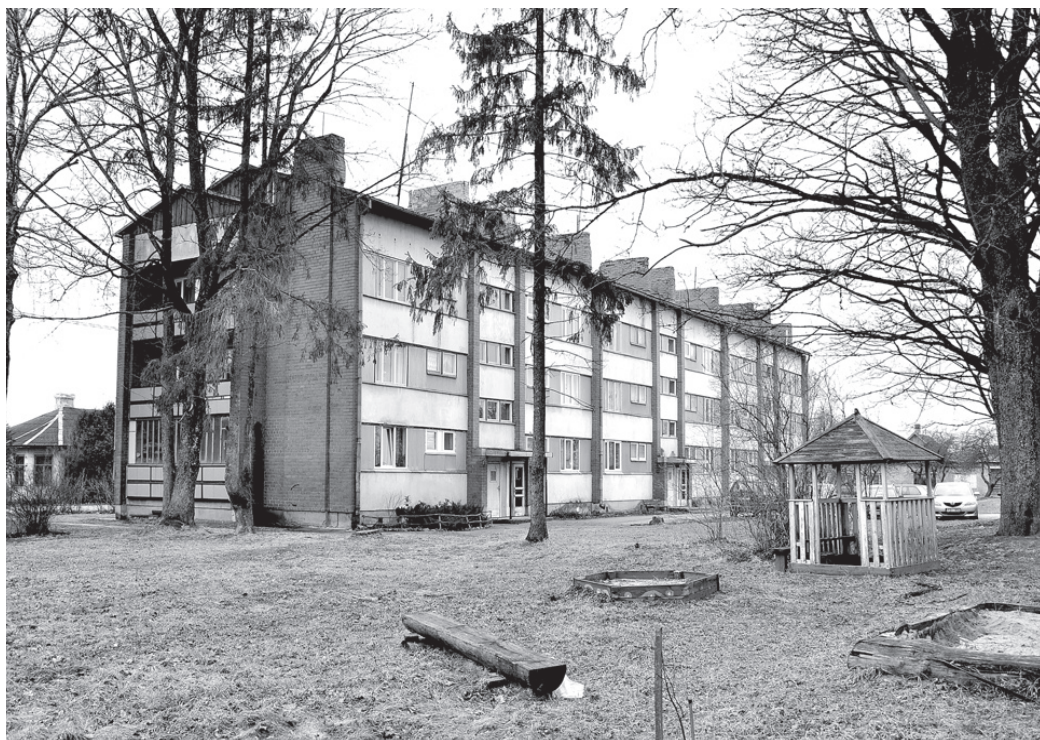
Apzinīgākie maksātāji ir komunālo pakalpojumu saņēmēji, kas dzīvo Kalna ielas 11. un 13. namā (mājas bez centrālāpkures) un Sporta ielā 2 (attēlā) Vecumniekos.

Jāatgādina, ka ūdens skaitītāja rādījumi jānolasa katra mēneša pēdējā datumā un trīs dienu laikā jāpaziņo grāmatvedības darbiniekiem. To var izdarīt, personīgi nododot šo informāciju vai ievietojot ziņojumu šim nolūkam izveidotajā spraugā kantora durvīs, kā arī zvanot pa tālruni 63976382 vai rakstot e-pastā: <musu-saimnieks@inbox.lv>.