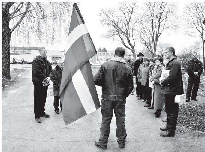
16. martā pie Vecumnieku tautas nama notika latviešu leģionāru atceres pasākums.