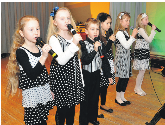
Ar skanīgu dziedājumu publiku iepriecināja Skaistkalnes tautas nama bērnu vokālais ansamblis.