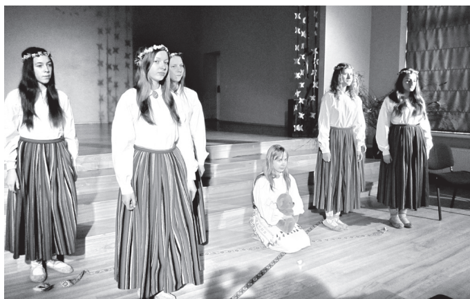
Skaistkalnes vidusskolas meitenes izrāda fragmentu no rokoperas «Lāčplēsis».

«Pēcpusdiena ar dzejnieces Māras Zālītes piedalīšanos bija ļoti pārdomāta un aizraujoša. Katras skolas sagatavotais priekšnesums bija ar savu «odziņu», un šķita, ka arī viešņa to novērtēja,» atklājot savas izjūtas, teic Valles vidus-