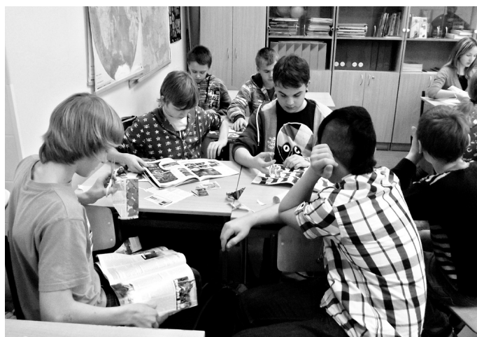
Skolēni gatavo kolāžu, lai izprastu, kā labāk ekonomēt energoresursus.