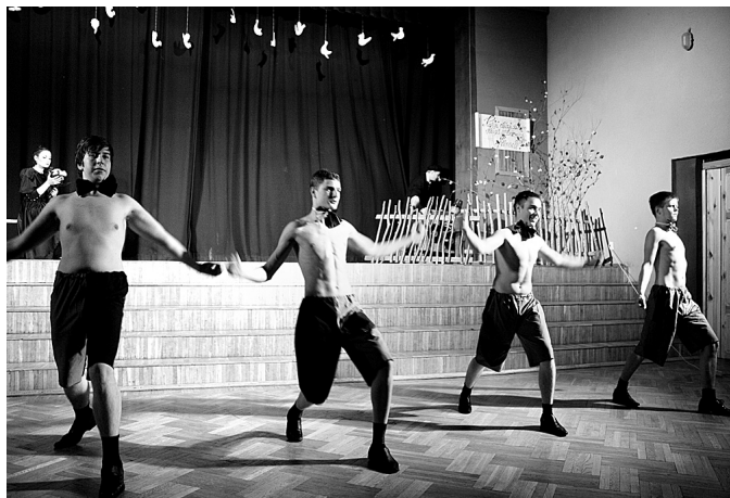
Puišu izpildītā dejas «Genoveva» izpelnījās skatītāju atzinību.

K. ANTONOVA, Misas vidusskolas 12. klases skolniece