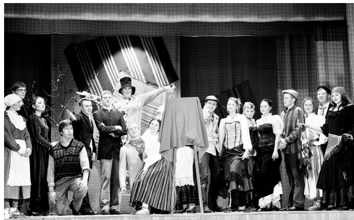
Izrādes «Īsa pamācība mīlēšanā» izskaņā tapa kopīgs foto.