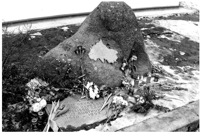
Latviešu tautai zīmīgās atceres dienās ļaudis pulcējas pie piemiņas akmens represijās cietušajiem Bārbeles pagasta iedzīvotājiem.