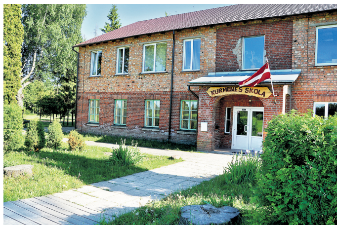
Šī gada maijā novada Dome pieņēma lēmumu slēgt Kurmenes pamatskolu.

Ļoti patīkami, ka par spīti problēmām finanšu jomā valstī, aktīvi darbojas pagasta zemnieki, uzņēmēji un nevalstiskās organizācijas. Tiek realizēti projekti un īstenotas daudzas idejas. Tas spodrīna gan uzņēmīgo ļauzu, gan Kurmenes tēlu novada mērogā.