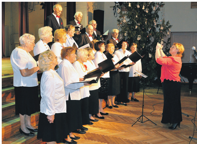
Senioru kora «Atbalss» sniegunā izskanēja vairākas dziesmas.