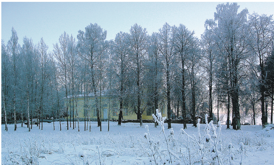
Ziemassvētki nāk ar gaišu ticību un sarmota rīta cerību...