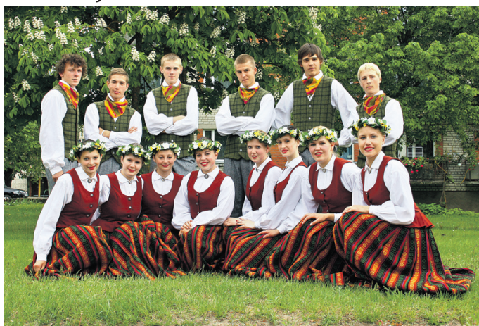
Skaistkalnes vidusskolas jauniešu deju kolektīvs «Vanadziņi».

Tāpat kā pagājušajā gadā, pasākumu vadīja mājinieki – Skaistkalnes vidusskolas JDK