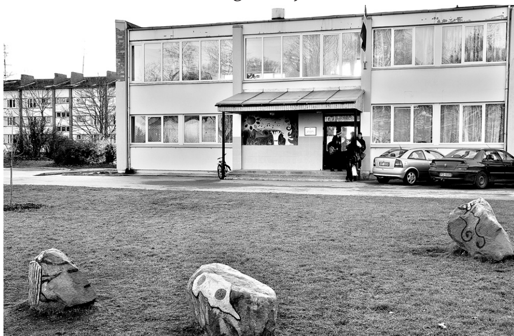
Vecumnieku mūzikas un mākslas skola tika izveidota 1996. gada decembrī. Šogad izglītības iestāde atzīmē 15 gadu jubileju.

2011. gada 1. septembrī Vecumnieku mūzikas un mākslas skolā mācības profesionālās ievirzes izglītības programmās uzsāka 138 audzēkņi. Sagatavošanas klases apmeklēja 20,