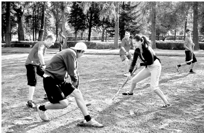
Tradicionālajā sporta dienā tika spēlēts arī florbols. Par bumbiņu cīnās 11. un 9. klases skolēni.

10. klases iesvētības vidusskolā, kā parasti, organizēja 11. klases skolēni. Šķiet, viņi vēl nav aizmirsuši, kā pērn tika