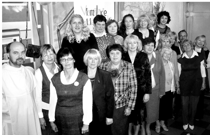
Skaistkalnes vidusskolas pedagogu saime Skolotāju dienā.

tupeļu futbols, precizitātes pārbaude, Pelnušķītes cienīgs pārbaudījums – zirņu un pupu šķirošana. Pa to laiku «jautrie pavāri» (pārstāvji no katras klases) grieza rasolu, lai pēc pārbaudījumu veikšanas visi to kopīgi notiesātu. Pasākuma sponsors arī šogad bija SIA «Kronis», kas nodarbojas ar gardu konservu gatavošanu. Uzņēmumā tapušo zaļo zirnīšu un marinēto gurķu garšu skaistkalnieši ir baudījuši ne reizi vien.