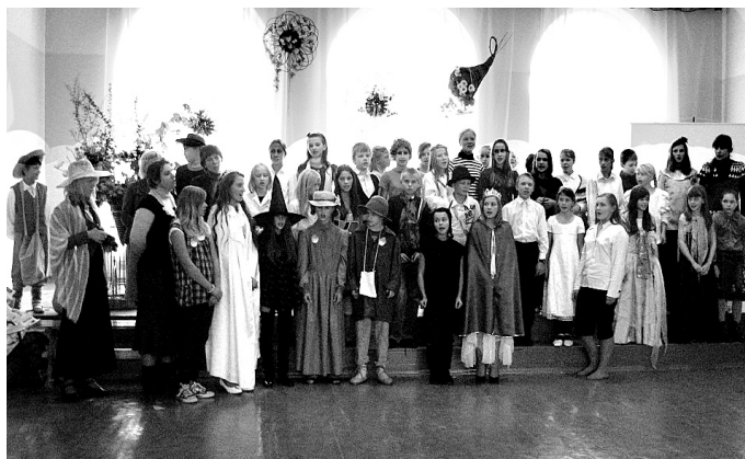
Rakstnieces Annas Brigaderes 150. dzimšanas dienas svinību izskaņā sarīkojuma dalībnieku kopkoris izpildīja dziesmu no mākslas filmas «Sprīdītis».

Valles vidusskolas komanda izrādīja fragmentu no lugas «Sprīdītis», atainojot pils pagalma skatu. Princese Zeltīte pasākuma dalībniekiem uzde-