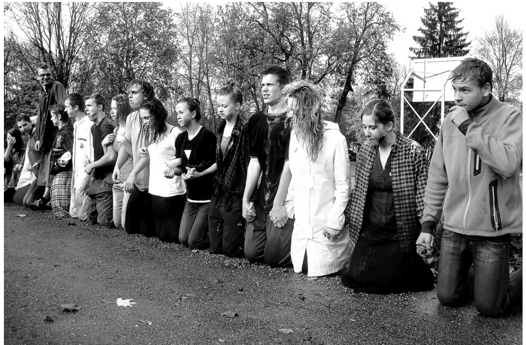
Jautras bija Skaistkalnes vidusskolas 10. klases iesvētības. Pēc godam izturētajiem pārbaudījumiem skolēniem atlika vien nodot zvērestu un saņemt apliecības.

Rudens sporta spēles jeb ikgadējā sporta diena notika 2. septembrī. Klases iesaistījās gan komandu spēlēs – futbolā, volejbolā, florbolā, tautas bumbā, gan veica citas sporta disciplīnas – pildbumbas mešanu, tāllēkšanu no vietas, staigāšanu ar koka kājām, «purva» šķērsošanu, mezgla siešanu, riņķu mešanu, stafeti. Skolēni varēja demonstrēt izturību un izveicību, komandas garu, saliedētību,