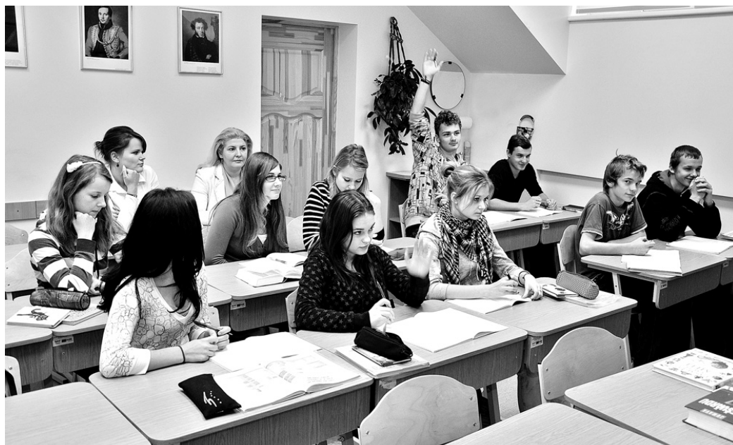
Skaistkalnes vidusskolas 10. klases skolēnu darbam literatūras stundā sekoja 11. Saeimas deputāte Vineta Poriņa (pēdējā rindā no labās).

Iesaistoties diskusijā ar Skaistkalnes vidusskolas pedagogiem, deputāte, kura ir Saeimas Izglītības, kultūras un zinātnes komisijas priekšsēdētājas biedre, bija vienprātīgi ar skolotājiem, ka mācību programmā paredzētās divas stundas nedēļā