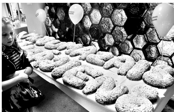
Gards bija konkursa organizatoru sarūpētais kliņģeris.