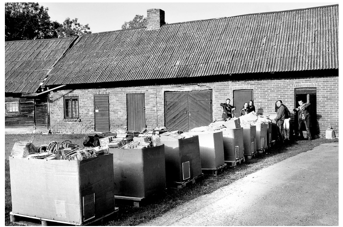
Audzēkņu savāktā makulatūra satilpa 17 konteineros.