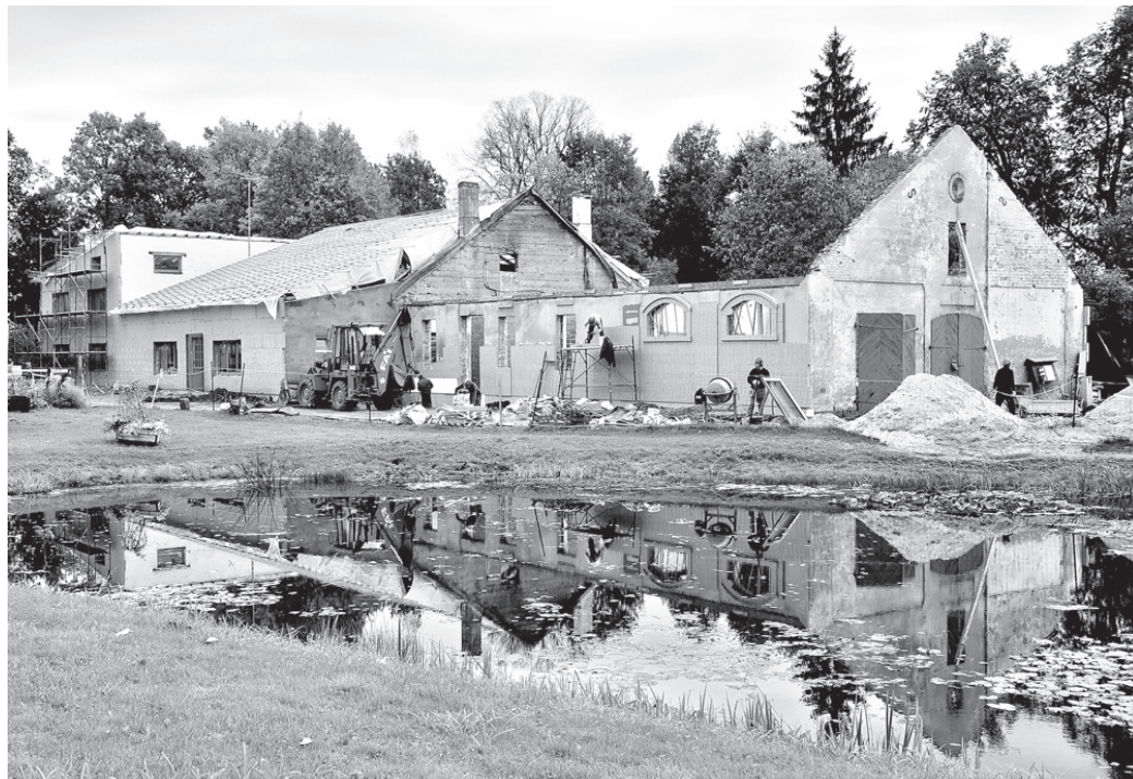
Skaistkalnes tautas nama rekonstrukcija sākās augustā.

Skaistkalnes tautas nama ēkas rekonstrukciju ir plānots pabeigt līdz 2012. gadam. Līdz nākamā gada maijam pašvaldībai Lauku atbalsta dienestā (LAD) ir jāiesniedz ar projek-