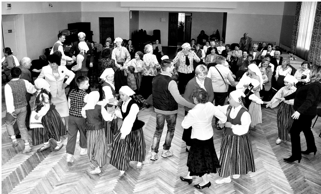
Sarīkojuma apmeklētāji kopā ar folkloras kopas «Tarkšķi» dalībniekiem gāja rotālās.