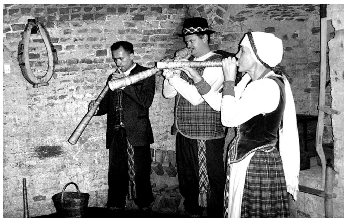
Biržu pils pagrabīnā tūristus izklaidēja folkloras ansamblis.