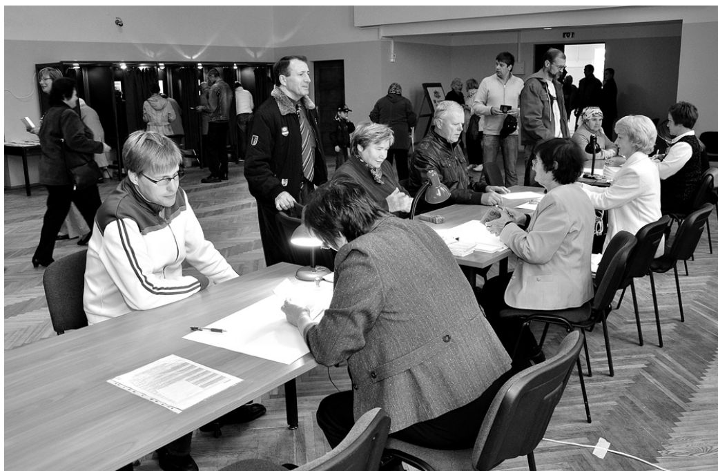
Vecumnieku vēlēšanu iecirknī brīžiem ļaužu pieplūdums bija tik liels, ka cilvēki stāvēja rindā.

17. septembrī Vecumniekos notika rudens tirgus. Apskatījuši piedāvājumu, ļaudis steidzās uz tautas namu novēlēt un pēc tam atgriezās, lai iegādātos nolūkoto preci. Arī pārdevēji, palūguši kaimiņam pieskatīt savu mantību, sameklēja pasi un devās uz iecirkni. Lai gan tirgo-