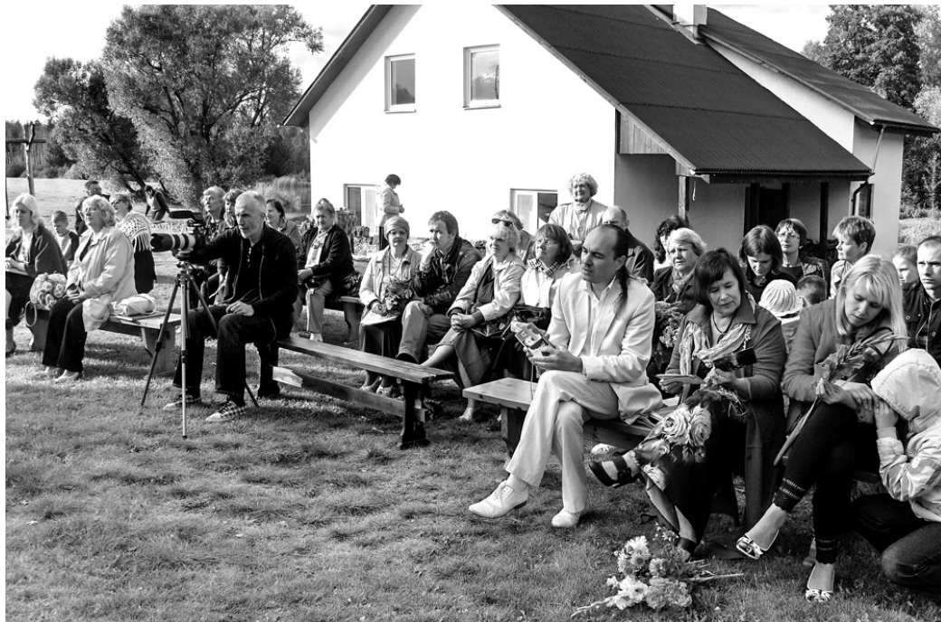
Sarīkojums Bārbeles pagastā kopā pulcināja tos, kam tuva dzeja un māksla.

Tā «Griķmalēju dzejas pleņrā» dziedāja viens no Latvijas bardiem Kaspars Dimīters. Muzikālo ietēru «Sutru» pagalmā un pasākuma noslēgumā