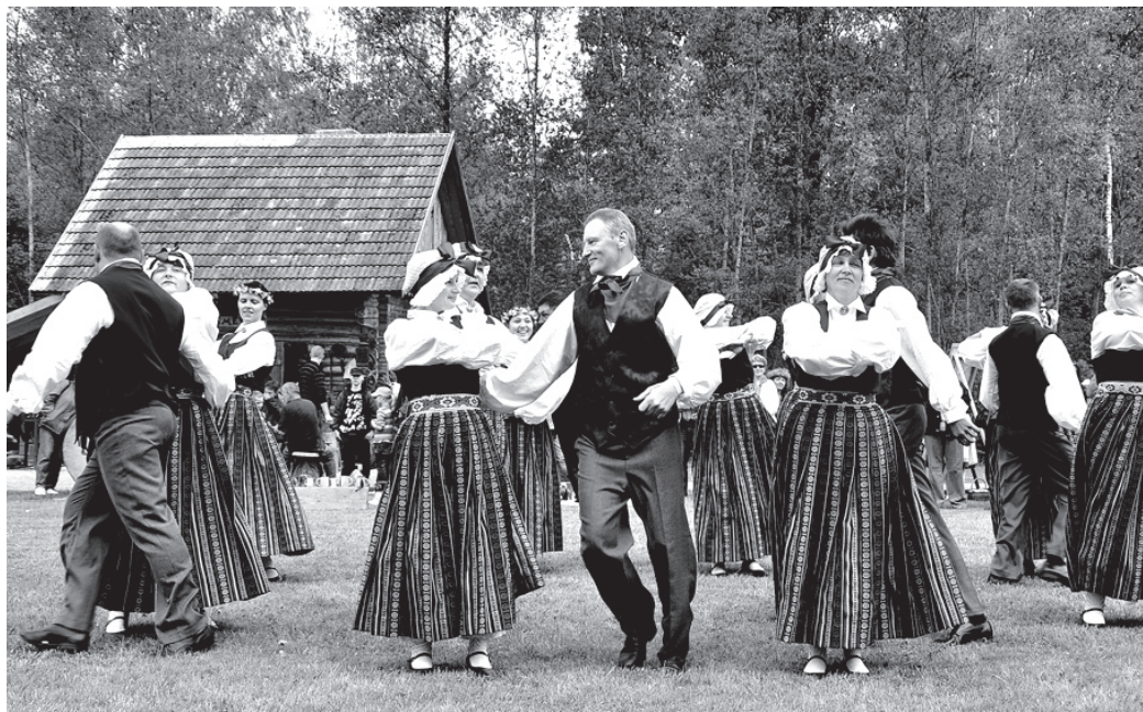
2009. gadā izveidotajā Stelpes pagasta deju kolektīvā vēl pērn raitu soli vija tikai sievas. Šopavasasar viņām izdevies savā pulkā iesaistīt arī vīrus.

Neraugoties uz dažnedažādām problēmām, sezonu uzsākuši četri sieviešu vokālie ansambļi – «Vēja meitenes» (Misa), «Vēl mazliet» (Skaistkalne), «Zeltenes» (Stelpe) un Valles dziedātājas.