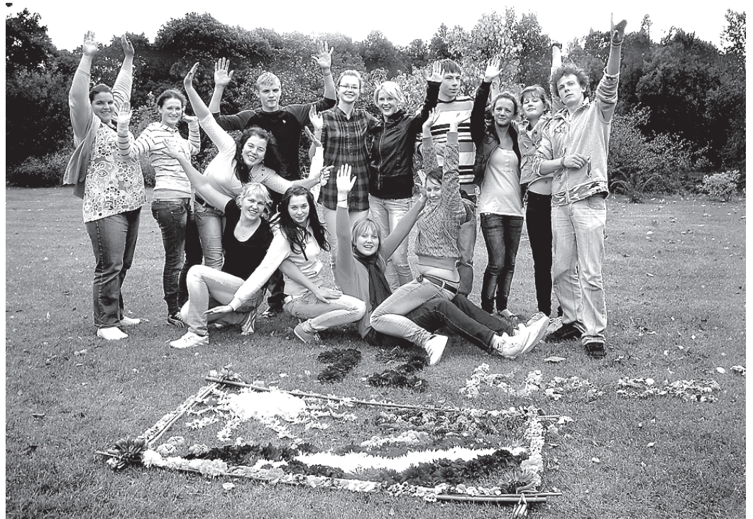
Skaistkalnes vidusskolas 12. klases jaunieši un viņu darinātā ziedošā dekorācija «Saule. Pērkons. Daugava».