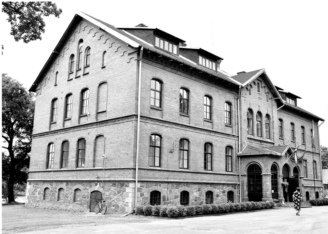
Skaistkalnes vidusskolā 2011./2012. mācību gadā ir 193 audzēkņi, pirmsskolas grupu apmeklē 27 bērni (dati – 5.09.2011.).

Skola šodien nodrošina saviem audzēkņiem izglītību septiņās dažādās programmās, viena no tām – profesionālās ievirzes programma, kas palīdzēs jauniešiem gūt sasniegumus dzīvē. Skolēnu panākumi ir nozīmīgi gan viņiem pašiem, gan viņu potenciālajiem darba devējiem un mācību iestādēm, ko viņi turpmāk apmeklēs. Mūsu skolēni ir mainījušies, un viņu izglītošanai vairs neder vecā sistēma. Skaistkalnes vidusskolas pedagogi ir sava mācību priekšmeta profesionāļi, taču ir ļoti sarežģīti nodot bērniem tās kompetences un zināšanas, kas viņiem būs vajadzīgas vis-