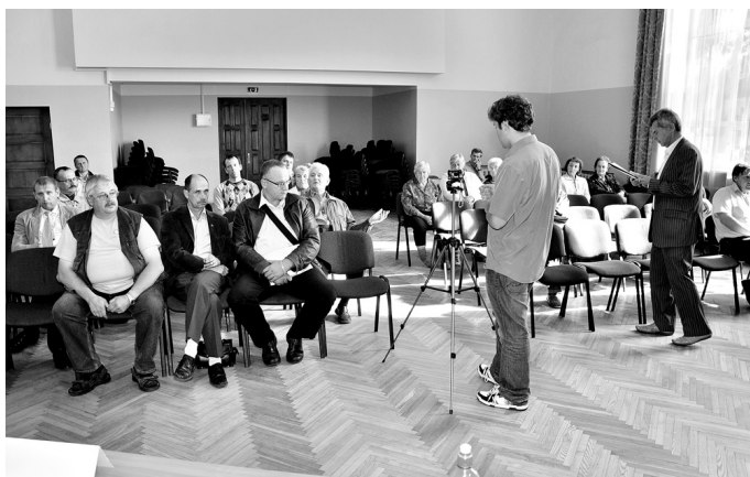
Lai aktivizētu vēlētāju iesaistīšanos politiskajos procesos, «Bauskas Dzīve» Vecumniekos organizēja diskusiju.

Politīki tika rosināti analizēt, vai ļaužu aizplūšana no laukiem ir kļūdainas vai nerealizētas reģionālās politikas rezultāts, taču vairums klātesošo konkrētu atbildi nesniedza, vien atzīmēja, ka īsti nav attaisnojušies administratīvi teritoriālās reformas (ATR) īstenošana. Iz-