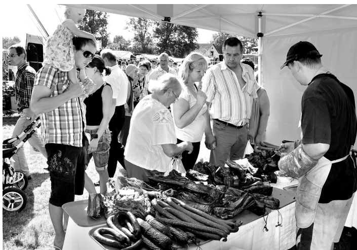
Nogaršojuši bauškenieku gatavotās desas un kūpinājumus, pircēji labprāt tos arī iegādājās.