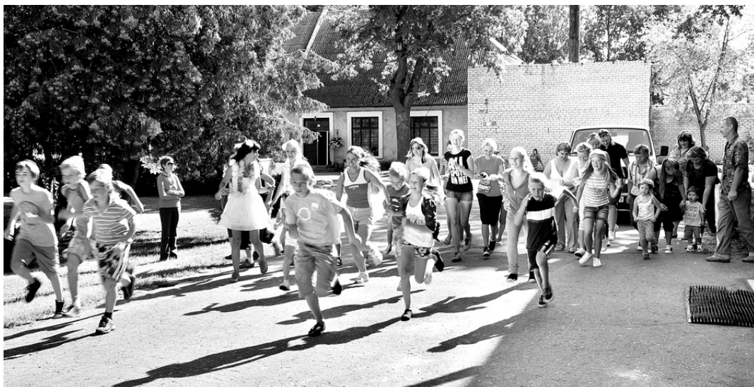
Tautas skrējienā 6. augustā piedalījās 37 dalībnieki.