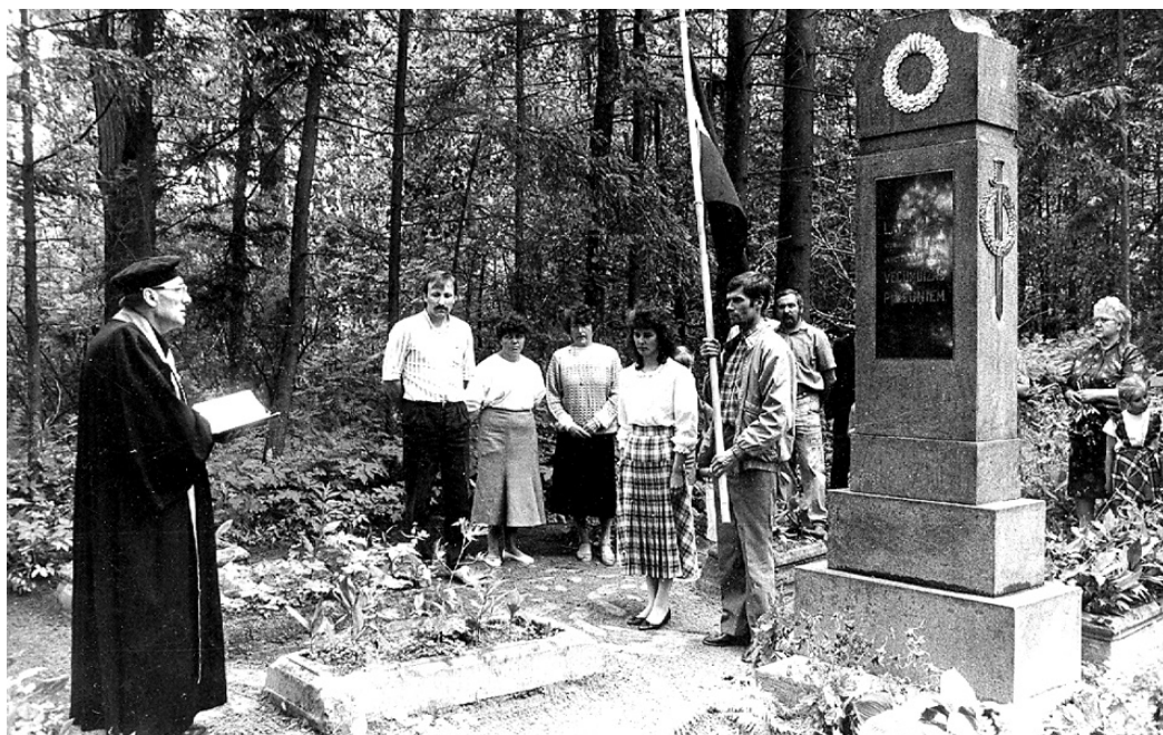
1991. gada 22. jūnijs. Atjaunotā pieminekļa iesvētīšana Rešenieku kapos.

Pēc viņa lūguma pieminekli atklāja Bauskas apriņķa valdes priekšsēdētājs R. Kulkītis, kurš nodeva to sabiedrības kopšanā un sargāšanā un mūžīgiem laikiem.