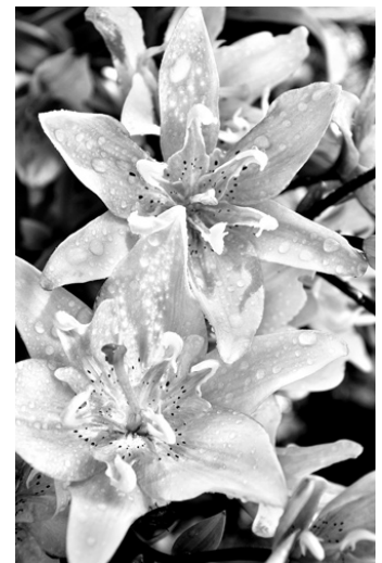
Lilijas ir vieni no vissenākajiem kultūraugiem.