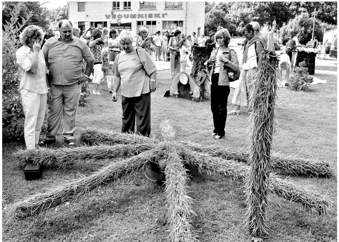
Floristu veidotās kompozīcijas aplūkoja gan svētku apmeklētāji, gan ziedu kārtotāju kolēģi.