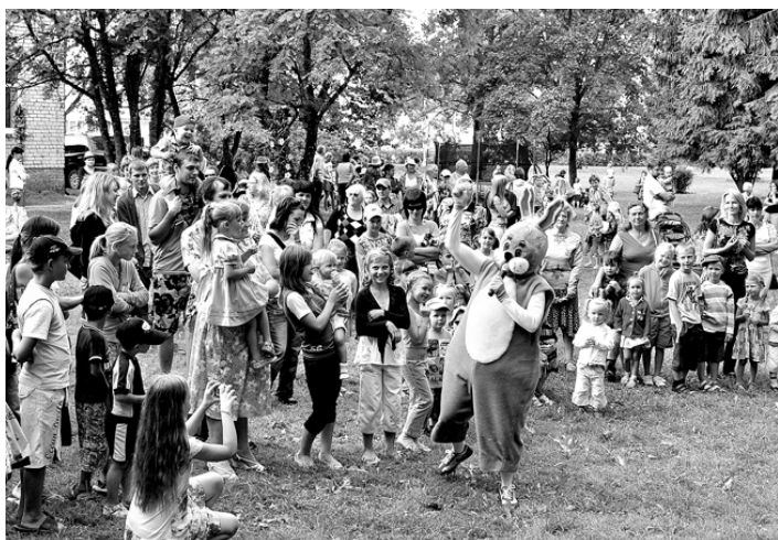
Draiskais zaķis no Leļļu teātra gādāja par jautrību parkā aiz tautas nama.