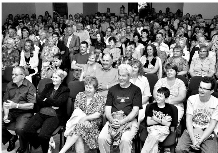
Kupli apmeklēts bija gan kora «Via Stella», gan grupas «Baltie lāči» koncerts.

gadu aug, tādēļ organizatoriem jābūt īpaši radošiem, lai darbu tēmas neatkārtotos un būtu saistošas. Šoreiz mājas uzdevums bija izveidot interjera objektu «Latvju rakstu zīmes», kas tika novietots zālienā pie tautas nama, bet apsveikuma pušķis «Ejam ciemos» tika darināts žūrijas un skatītāju klātbūtnē tautas nama lielajā zālē.