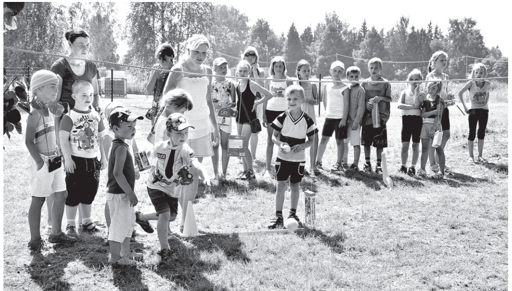
Visas dienas garumā Valles stadionā sapulcējušies bērni varēja iesaistīties dažādās aktivitātēs.