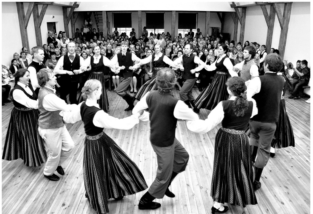
Tautas nama rekonstruētās ēkas atklāšanas svinībās priekšnesumus sniedza Bārbeles pagasta amatierkolektīvu dalībnieki.

Bārbeles tautas nama atjaunotās ēkas atklāšanas sarīkojums 29. aprīļa vakarā izvērtās par īstiem svētkiem gan mājniekiem, gan viesiem.