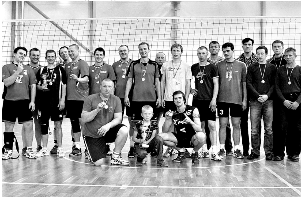
Valles kausa izcīņā volejbolā vīriešiem godalgas ieguva Vecbebru, Valles un Aizkraukles sportisti.