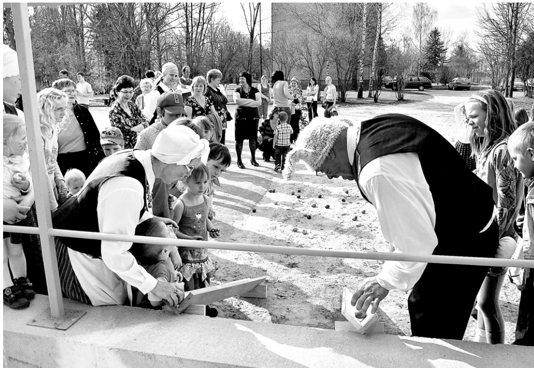
Ar aizrautību vallieši iesaistījās olu ripināšanā.