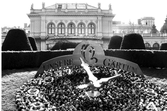
Vīne lepojas ar skaistiem apstādījumiem. Tūristu acis priecē ziedu pulkstenis pilsētas parkā.

Katedrālei ir vairāki torņi, altāri, brīnumskaisti vitrāžu logi, zvani, kā arī lielas ērģeles. Pastaigājoties netālu no katedrāles, satikām klaunu. Ar viņu bija patīkami parunāties. Mazās un skaistās ieliņas apskatījām, baudot gardu saldējumu.