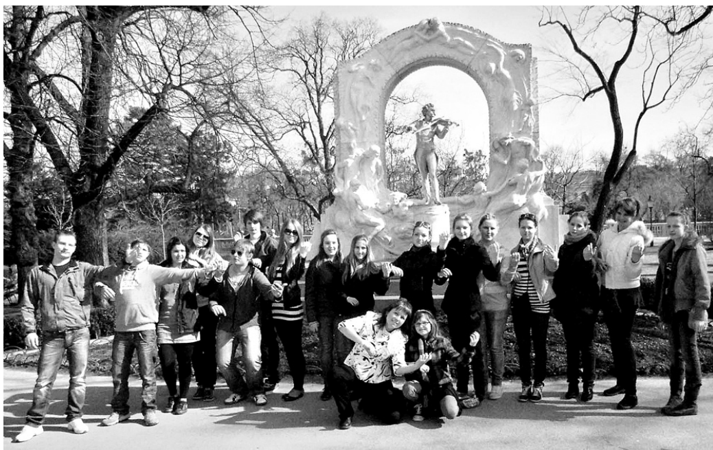
Vecumnieku mūzikas un mākslas skolas un Baldones mūzikas skolas apvienotā bērnu un jauniešu simfoniskā orķestra «Draugi» vijolnieki (paskat, cik viņu ir daudz!) pozē pie «valšu karaļa» Johana Štrausa statujas.

Kas gan būtu Austrija bez mazajiem Mocarta suvenīru veikalniņiem! Tie ir visur. Dižais komponists tika apglabāts ko-