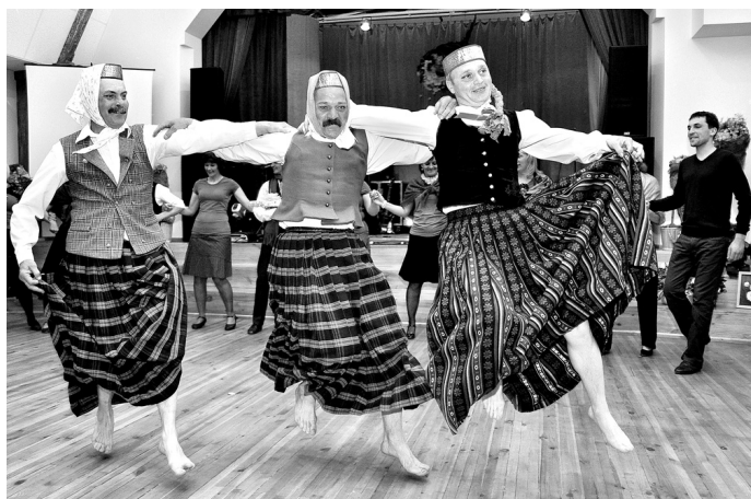
Ar atraktīvu priekšnesumu bārbeliešus sveica Vecumnieku tautas nama vidējās paaudzes deju kolektīvs «Vēveri».