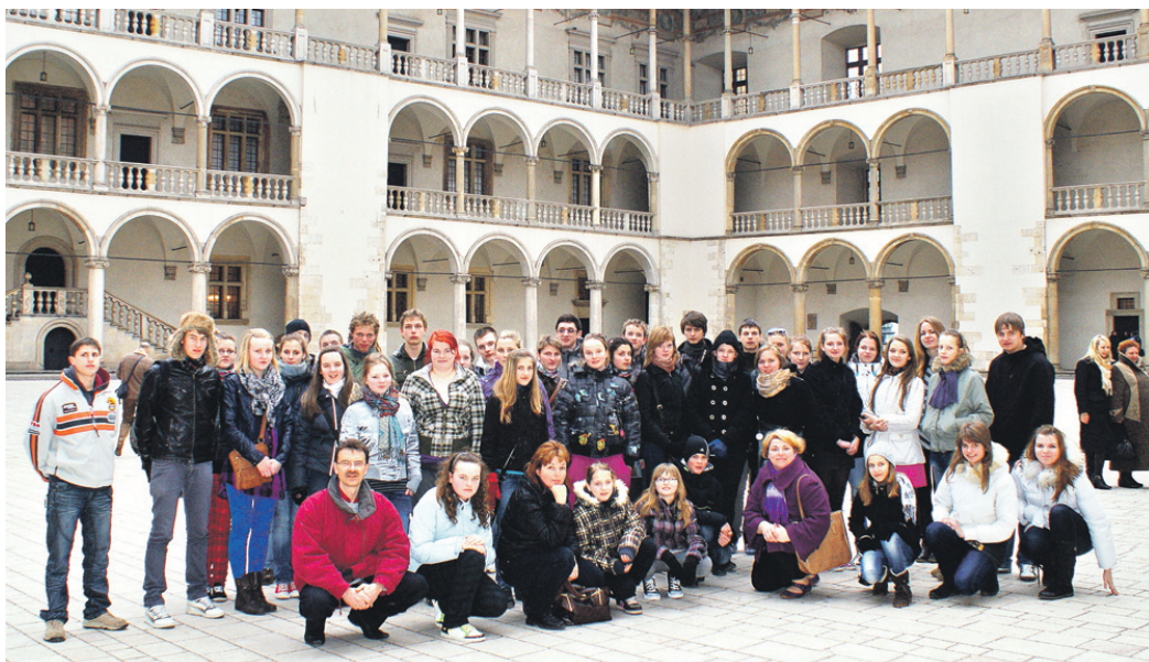
Vecumnieku mūzikas un mākslas skolas un Baldones mūzikas skolas apvienotais bērnu un jauniešu simfoniskais orķestris «Draugi» Vāveles pils iekšpagalmā Krakovā.