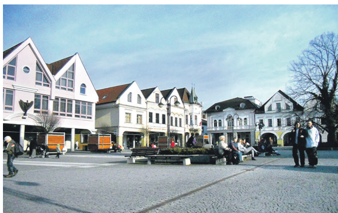
Žilinas centrālais laukums ir iecienīta pastaigu vieta.

Vispirms iepazīnām Demēnovas alās, kas atrodas Zemo Tatro Demēnovas ielejā. Šī alu