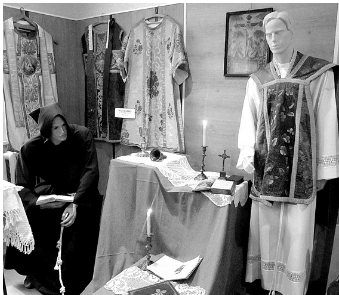
Skaistkalnes pagasta novadpētniecības materiālu krātuvē «Novadnieki» ir apskatāma ekspozīcija «Mūku ordeni Skaistkalnē».