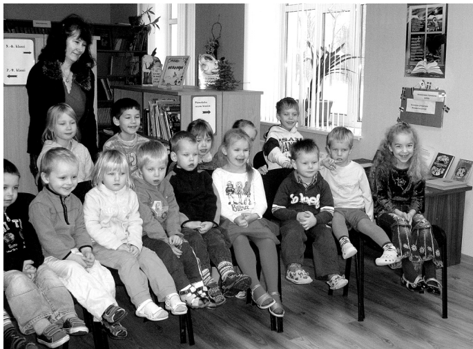
Mazie kurmenieši ar interesi noskatījās leļļu teātra izrādi «Pilsētas pele un lauku pele».