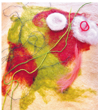
Veidojot filcētu spilvenu, iespējams ļaut vaļu fantāzijai.