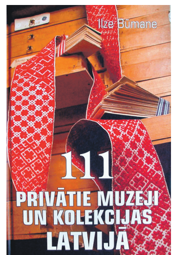
Grāmatas «111 privātie muzeji un kolekcijas Latvijā» atvēršanas svētki notika 8. decembrī.