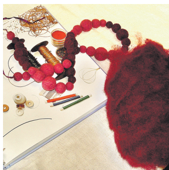
Materiālu dalībnieces gādā pašas, jo vilnas toņu ir tik daudz, bet gaumes – atšķirīgas.