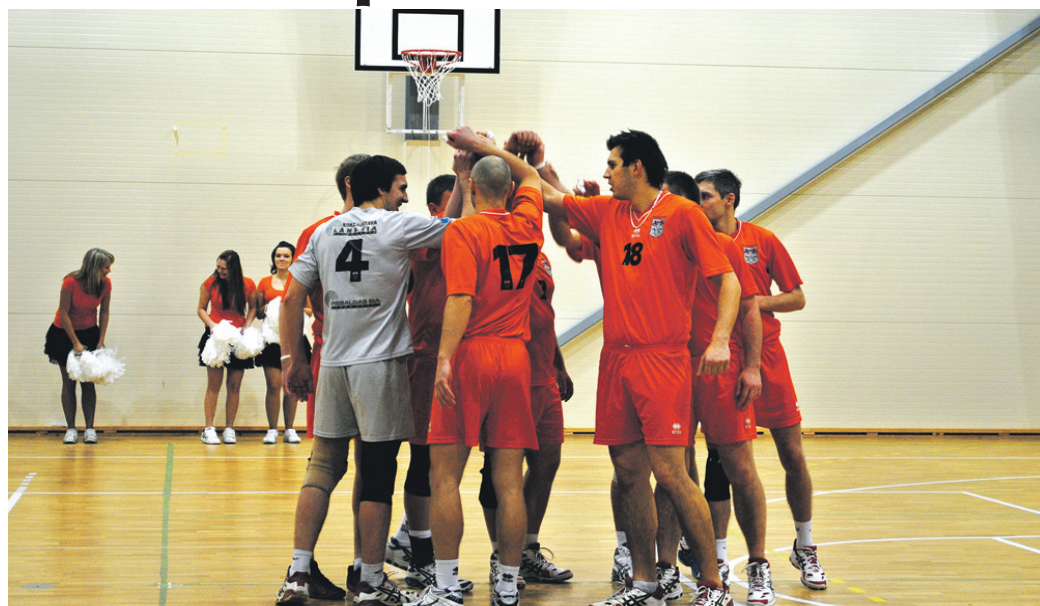
VK «Vecumnieki» volejbolisti priecājas par izcīnīto uzvaru.