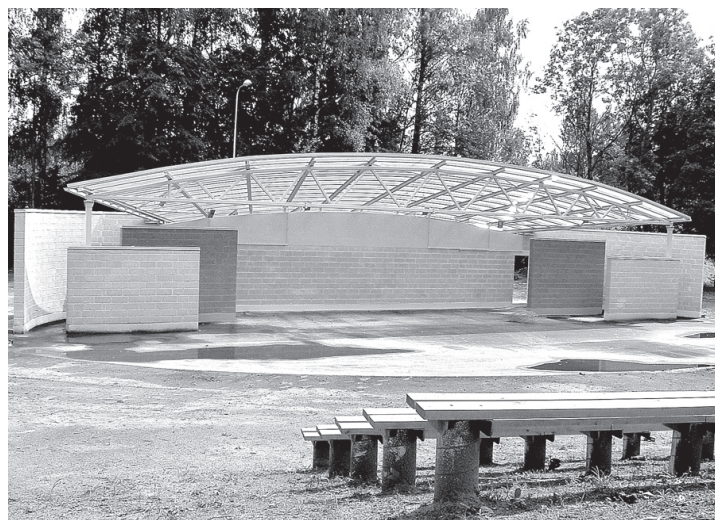
Stelpes estrādē sēdvietu pietiek ap diviem simtiem skatītāju.