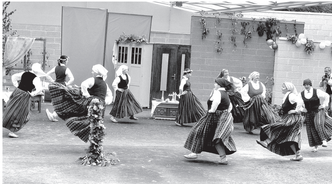
Raitu soli vij Stelpes deju kolektīva dalībnieces.