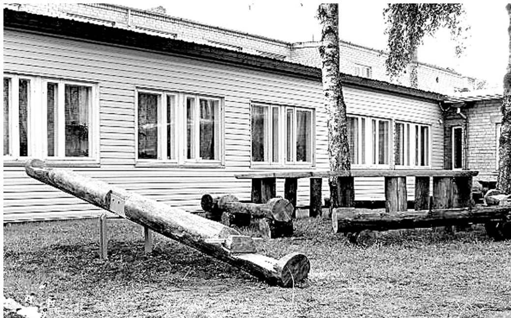
«Zaļā klase» un neliels stūrītis no skolēnu iekārtotā rotaļu laukuma.