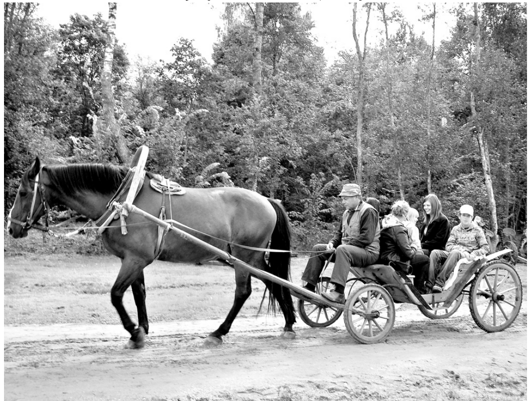
Plaujas svētku laikā vizināšanos zirga pajūgā jo īpaši bija iecienījuši bērni.

○ Brīvdabas muzejs pamazām kļūst par amatu skolu