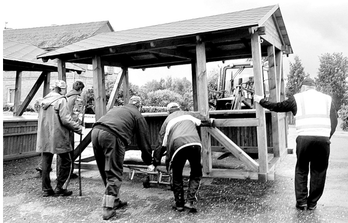
Tirgus nojumes tām paredzētajā vietā nogādāja tā saucamajā «simtlatnieku» programmā iesaistītie skaistkalnieši.

L. INDRIĶE, Skaistkalnes LSK «Mēmelīte» projektu vadītāja