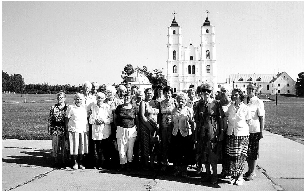
Pensionāru un invalīdu biedrības «Virši» pārstāvji, viesojoties Latgalē, apskatīja arī Aglonas baziliku.

No Aglonas ekskursanti atvaļējās, viesojoties Maizes muzejā. Tur katram bija iespēja izjust un redzēt latgaliešu darbī-