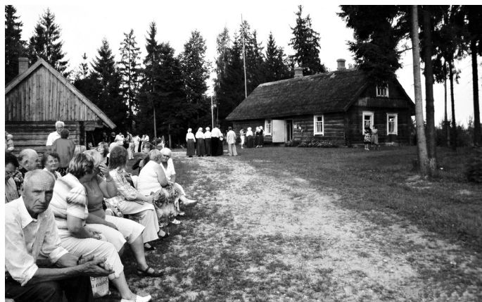
Andrupenes lauku sētā sapulcējušies ar nepacietību gaidīja koncerta sākumu.

Andrupenē katru gadu (šovasar – jau ceturto reizi) notiek deju kolektīvu un folkloras ansambļu festivāls. Vakarā uz estrādes dēļiem kāpa Andrupenes pagasta amatierkolektīvu dalībnieki, dejojotāji no tuvākās apkārtnes un Jūrmalas, kā arī no Vecumniekiem – deju kopa «Rudens rozes». Sākotnējais uz-