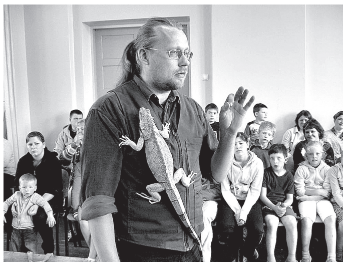
Rīgas Zooloģiskā dārza pārstāvji bija sarīkojuši īstu šovu!

ce iekoda kopējam rokā. Par to viņa tika iesprostota būrī, un ārā tā arī vairs netika līdz pat izrādes beigām. No Zooloģiskā dārza pārstāvjiem klātesošie uzzināja, ka pele ar ūsām var izmērīt ejas platumu un «aprēķināt», vai viņa tur var ielīst, vai ne. Ciemos atvestā iguāna, kas pašāvīgi rāpoja pa sava «šova partnera» apģērbu, atrasta kādā Rīgas vērtu rūmē. Augšanai un attīstībai nepiemēroto apstākļu dēļ tā nekad nevarēsot izaugt līdz pieaugušas iguānas parastajam izmēram.