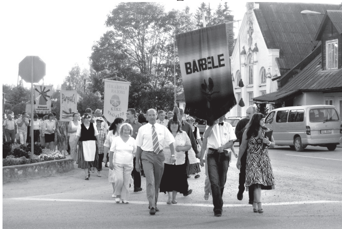
Ēdampagastu saiets 2008. gadā notika Bārbelē.

Pirmais ēdampagastu saiets notika 2000. gadā Tumes pagastā, otrreiz visi devās uz Zirņiem, bet trešā tikšanās bija Bārbelē 2002. gada augustā. Nākamajā gadā ciemos pie sevis aicināja Kūkas, tad – Pam-