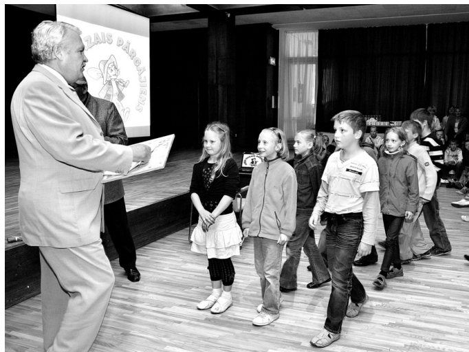
Skolēniem diplomu un balvu pasniedz zemkopības ministrs Jānis Dūklavs.

A. STAŠKEVIČA, Vecumnieku vidusskolas 2.a klases audzinātāja