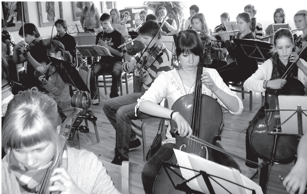
10. Latvijas skolu jaunatnes dziesmu un deju svētku simfonisko orķestru konkursa finālā lielsniegumu demonstrēja Vecumnieku mūzikas un mākslas skolas un Baldones mūzikas skolas apvienotais orķestris «Draugi».

Tikai četri kolektīvi kļuva par šī konkursa laureātiem un izcīnīja godu spēlēt J. Vītola Latvijas Mūzikas akadēmijas Lielajā zālē šī gada 6. jūlijā –