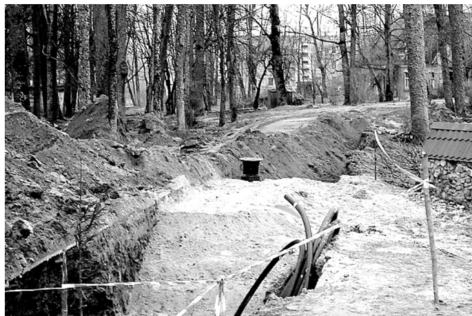
Ūdenssaimniecības projekta realizēšanas gaitā Kurmenē tiks izbūvēti jauni maģistrālie tīkli 101 un 592 metru garumā.