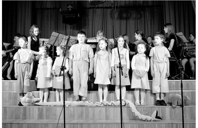
Jubilejas koncertā Skaistkalnes tautas namā kopā ar pūtēju orķestri droši uz skatuves kāpa arī bērnu vokālais ansamblis «Adatiņas» no Misas.

Cieša sadarbība pūtēju orķestrim ir izveidojusies ar Misas tautas nama sieviešu vokālo ansambli «Vēja meitenes» (vadītāja Olga Čerņišova-Stūriška). Kad kolektīva sastāvs vēl bija «zaļš» un bieži gadījās nospēlēt «šķībi», Misas meiteņu dziedājums koncertu vērtā skanīgāku un pilnvērtīgāku. Paldies ansambļa dalīb-