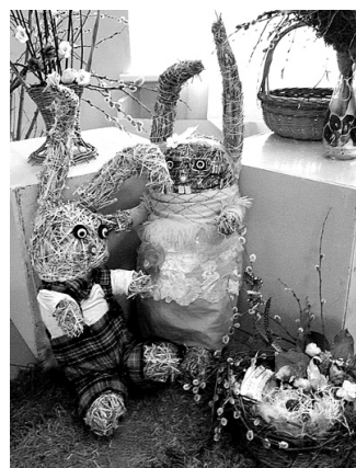
9. klases skolēnu darinātie Lieldienu zaķi.