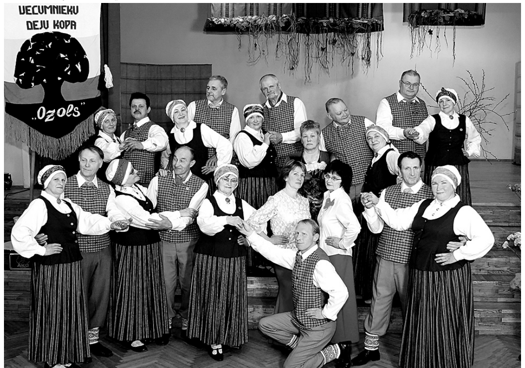
Senioru deju kopas «Ozols» dalībnieku skatuves solis ir raits un apliecina vīru un sievu degsmi, azartu un dejas mīlestību.