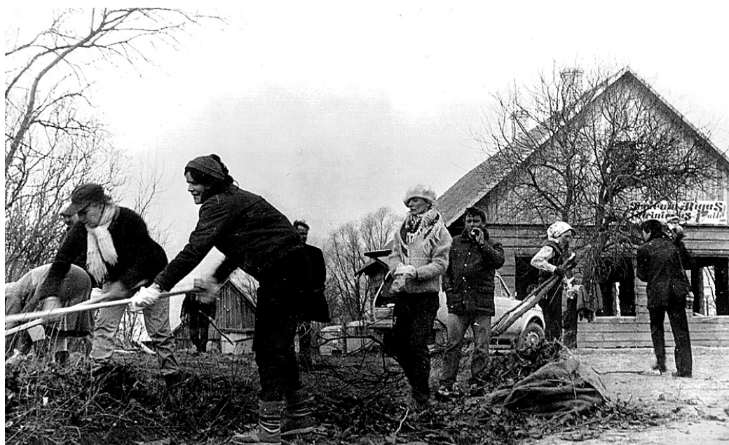
«Zvanītāju Buku» dārzā rosās Latvijas Nacionālā teātra aktieri. 1985. gada aprīlis.