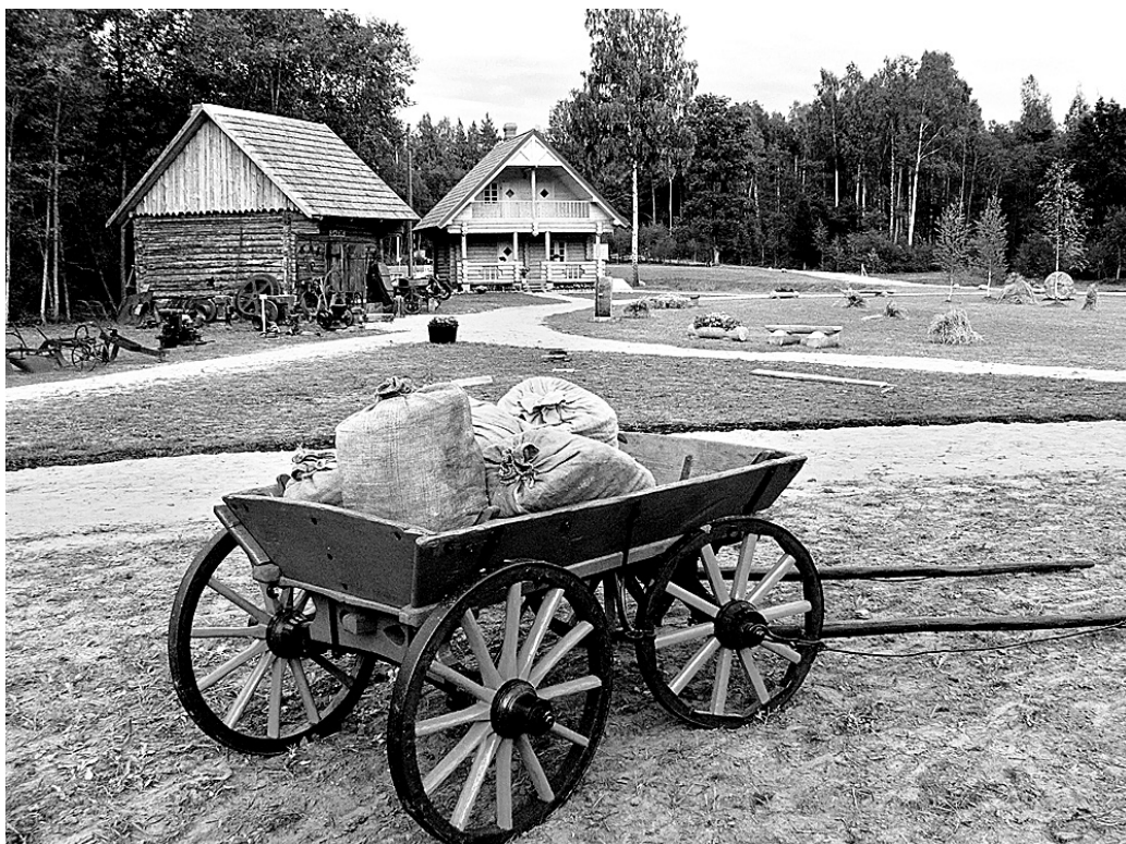
Ausekļu dzirnavu brīvdabas muzejs Bārbeles pagastā savus pirmos apmeklētājus sagaidīja 2009. gada 5. septembrī.

Aicinām ikvienu seno amatu pratēju, amatnieku un citus interesentus 8. maijā būt svētku dalībnieku pulkā (pieteikties