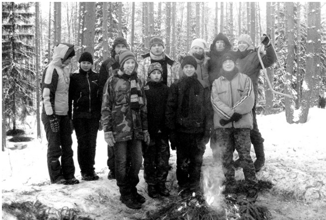
Bārbeles skautu un gaidu vienības pārstāvji nometnē «Baltais vilks» piedalījās pirmo reizi.

Dalot pienākumus un veicamos darbus, jaunieši ir atbildīgi gan par sevi, gan pārējiem nometnes dalībniekiem. No tā, cik rūpīgi tiks ieklati egļu zari teltī, ir atkarīga ikviena labsajūta, dodoties pie miera. Malkas sagāde un telts krāsniņu kurināšana ir īpaši svarīgs rituāls, jo, pieļaujot kļūdu, naktī salt nāksies visiem. Lai rūpētos par siltumu teltī, katra apakšnometne varēja izvēlēties gan kopīgo naktssardzi, kas gādā par krāsniņas kurēšanu, gan norīkot šim darbam savus pārstāvjus.