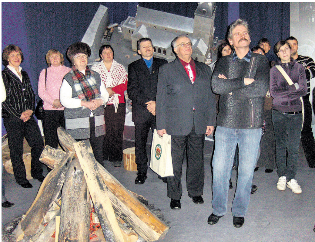
26. janvārī bārbelieši apmeklēja 1991. gada barikāžu muzeju Rīgā.

○ Piemiņas zīmes ir saņēmuši 58 bārbelieši