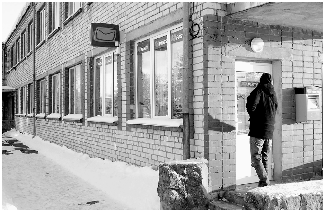
19. janvāris bija Bodnieku pasta nodaļas pēdējā darbdiena.

Misas ciema un lauku teritorijas iedzīvotāji cerībā, ka kāds viņu viedokli sadzirdēs, nosūtījuši atklātu vēstuli va/s «Latvijas Pasts» vadībai, Vecumnie-