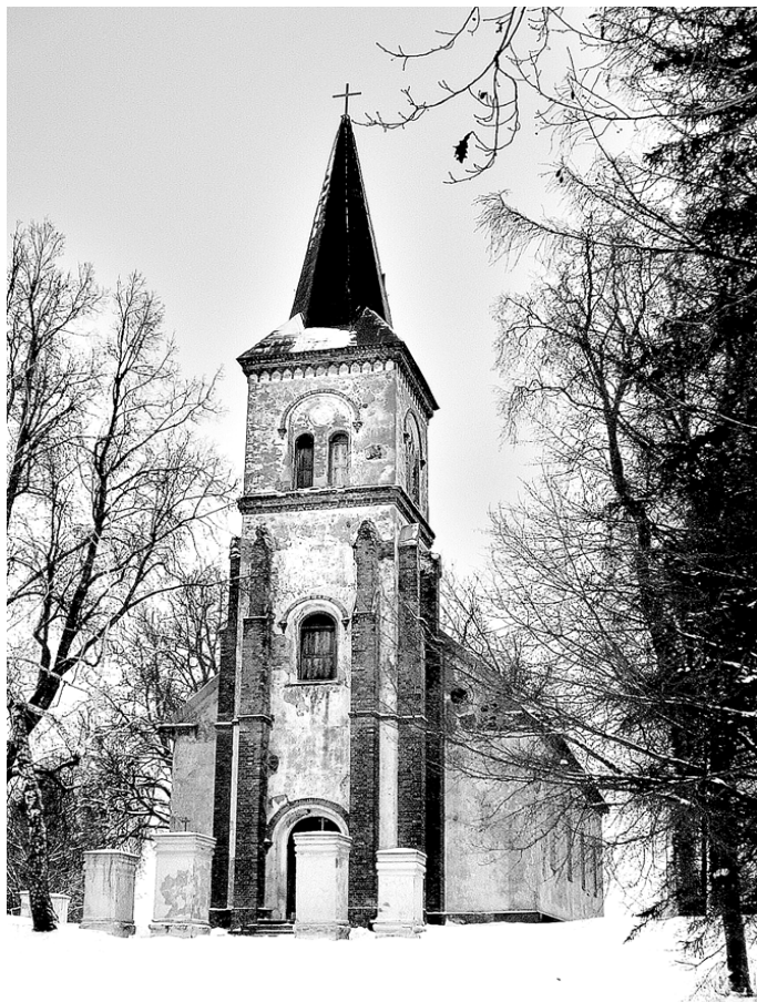
Valles dievnams ir vecākā luterāņu baznīca Vecumnieku novadā.

Valles evaņģēliski luteriskā draudze, draudzes padome un mācītājs aicina ikvienu Vecumnieku novadā, Valles pagastā, kā arī mūsu draugus Lat-