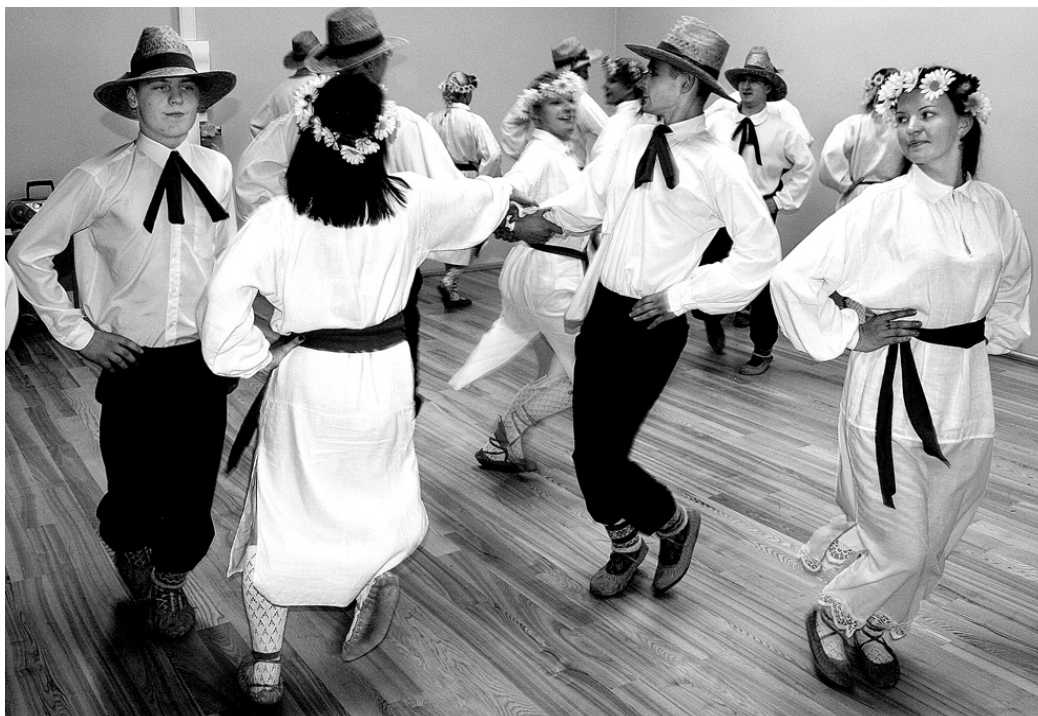
Jauniešu deju kolektīva «Valle» dalībnieki klātesošos aizveda «ceļojumā» uz Igauniju.

Vidusskolas «Vallēni» ciemojās Krievijā, Amerikā un Āfrikā, jauniešu deju kolektīvs «Valle» devās uz Igauniju, Saūda Arābiju un Havaju salām, bet vidējās paaudzes deju kopas svētkus atzīmēja Ziemeļpolā, Vjetnamā un Spānijā. Prieks, ka visi atgriezās mājās!