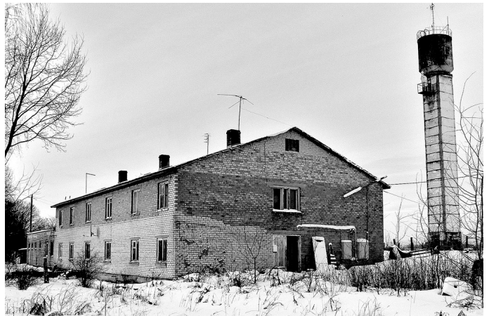
Daudzdzīvokļu ēka «Palejas» Stelpes pagastā ir pašvaldības īpašums, kas jau ilgstoši ir tikai daļēji apdzīvots.