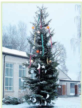
Egle pie Vecumnieku tautas nama nolūkota tuvējās apkāmes mežos.