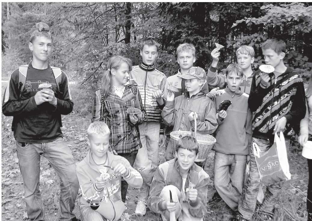
Bārbeles mazpulka dalībnieki ar prieku iesaistās dažādās nodarbībās, kas tiek organizētas brīvā dabā.

Šajos gados Bārbeles mazpulks ir piedalījies 15 Zemgales reģiona vai valsts mērogā organizētajās rudens darbu skatēs un 10 dažādās nometnēs. Ir notikušas 12 vietējās nometnes, veikti astoņi grupas pro-