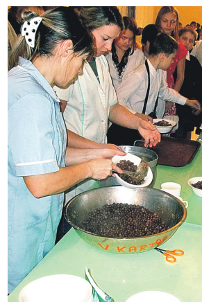
Pusdienās tika pasniegti garšīgi pagatavoti pelēkie zirņi.