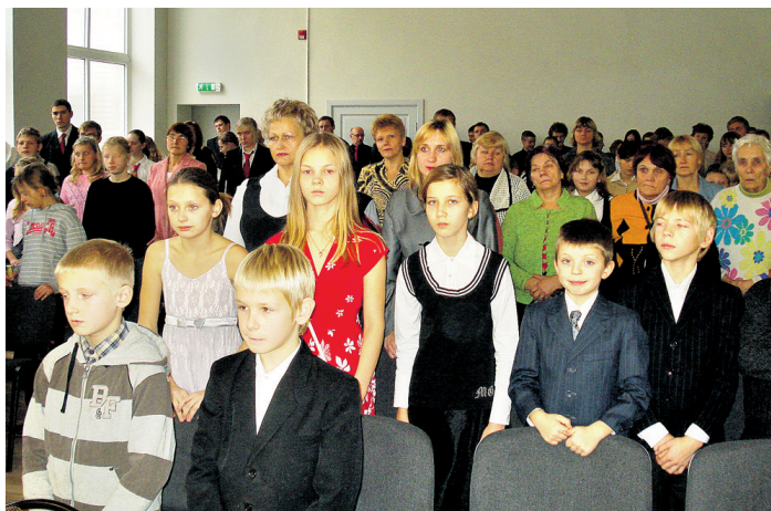
Sarīkojums «Eju pretī gaismai» mudināja aizdomāties par vērtībām, ko sabiedrība pamazām zaudē.