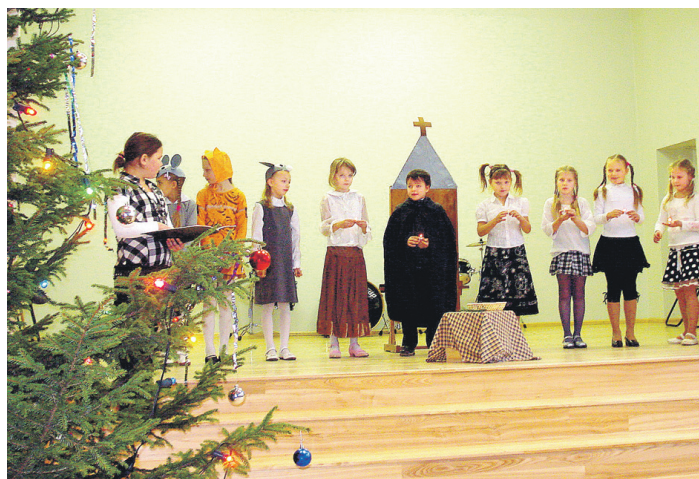
Vecumnieku vidusskolas sākumskolas audzēkņi izrādīja iestudējumu par veco baznīciņu, kurai nokritis zvaniņš.

Priekšnesumus noslēdz mājinieki – Valles vidusskolas au-