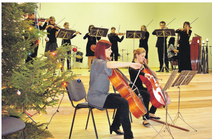
Klausītājiem par prieku muzicēja Vecumnieku mūzikas un mākslas skolas ansamblis un čellistes.