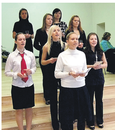
Ar izjūtu dziedājumu uzstājās Skaistkalnes vidusskolas meiteņu vokālais ansamblis.