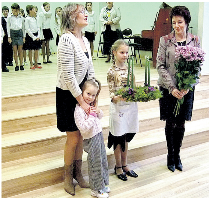
Klātesošos sveica Misas vidusskolas pārstāves.