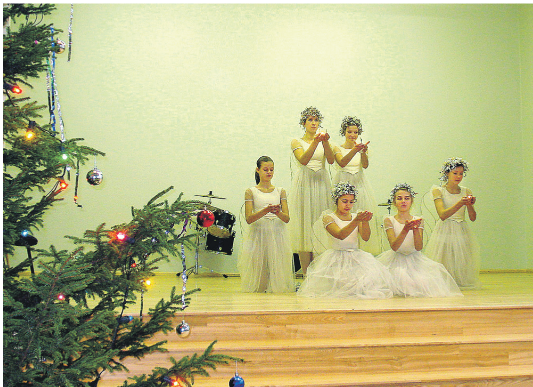
Bārbeles pamatskolas baleta pulciņa meiteņu uzstāšanās bija pārsteigums ikvienam.

Izskan divas kopdziesmas – «Dari mani, mīļais Jēzu» un «Tur