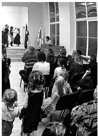
Kultūras centra jaunās telpas ir gaišas un mājīgas, dziedātāji jau paguvuši novērtēt zāles labo akustiku, bet deļotāji – gludo skatuves grīdu.