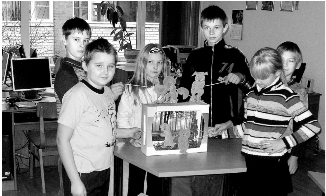
Rītausmas stundā Valles vidusskolas 4. klases skolēni izspēlēja pasaku «Zvēru karš».

Valles pagasta bibliotēkā Rītausmas stundas pasākums Valles vidusskolas 4. klases skolēniem notika 12. novembra rītā. Ar bērniem tika runāts par miera un kara tēmu, Lāčplēša dienu un ko