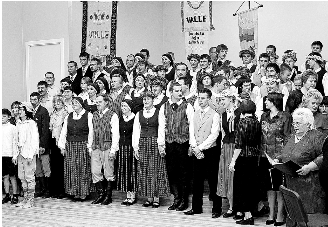
Vallē darbojas piecas amatierkopas, kurās savam vaļaspriekam nododas vairāk nekā 90 pagasta iedzīvotāju.