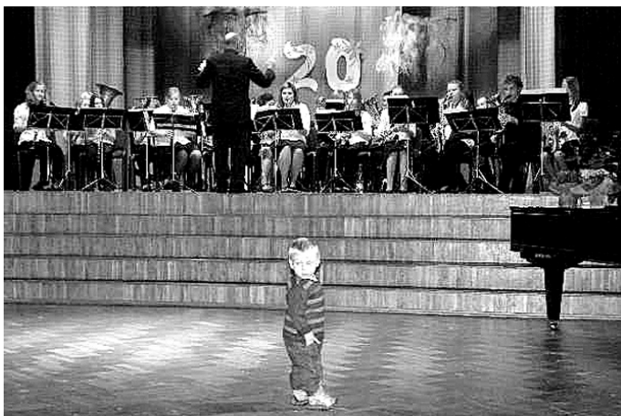
Misas tautas nama sieviešu vokālo ansamblis «Vēja meitenes» un pūtēju orķestri «Skaistkalne» (attēlā) vieno draudzība un dziesmas mīlestība.