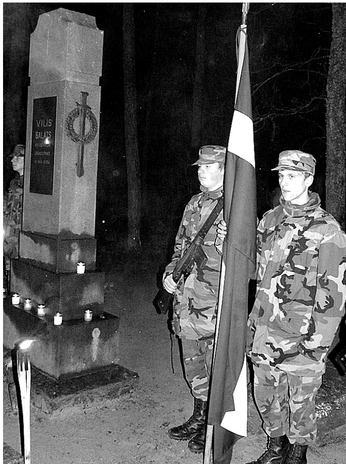
Pie pieminekļa Brīvības cīnītājiem Rešnenieku kapos sardzē braši stāvēja Vecumnieku vidusskolas jaunsargi. Foto – A. SPROĢE

Patīkama un konstruktīva saruna izvērtās Kurmenes pagasta pārvaldē. Tika pārrunāti jautājumi, kas skar projekta «Iniciatīvu un kultūras centra izveide Kurmenē» realizāci-