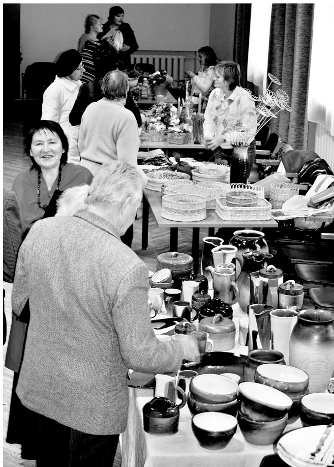
Sarīkojuma «Vasaras pēdas rudenī» apmeklētāji ar interesi aplūkoja Vecumnieku novada amatnieku darinājumus.