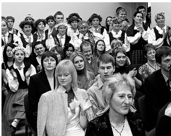
Izremontētājā zālē ir paredzētas vietas aptuveni 200 skatītājiem.