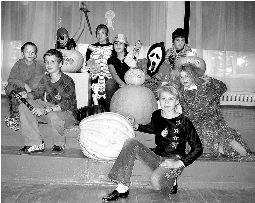
Stelpes pamatskolas 6. klases audzēkņi jūtas gandarīti par to, ka Lielā ķirbja svētki bija izdevušies.

○ Stelpes pamatskolā svin Lielā ķirbja svētkus