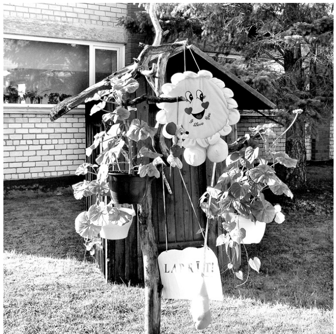
«Cielaviņas» audzēkņus 1. septembrī sagaidīja Saulīte, Pelēns un Rūķis.

Pirmsskolas izglītības iestādē lielākajiem bērniem ir iespēja piedalīties ritmikas nodarbībās, bet, sākot no četrus gadu vecuma, mazuļi var apgūt angļu valodu. Šāda iespēja bērnudārzā ir pirmo gadu.