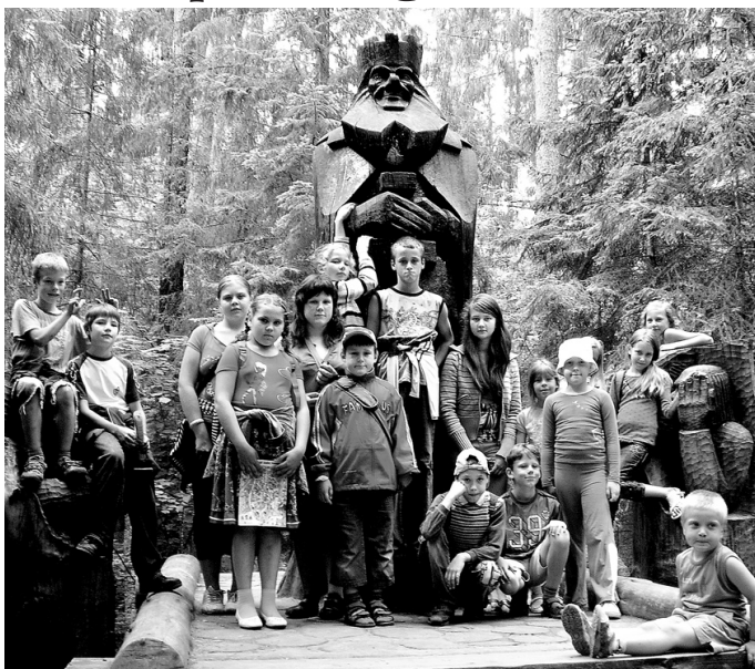
Iespēja apmeklēt Tērvetes dabas parku Misas bibliotēkas lasītājiem bija jauks piedzīvojums.

Misas bibliotēkas lasītāji ik gadu dodas ekskursijā. Šo-