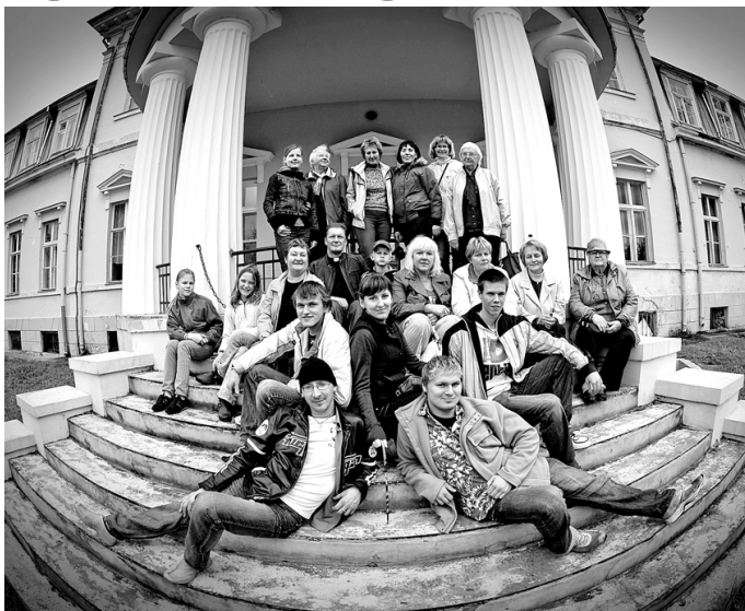
Valles evaņģēliski luteriskās draudzes organizētās ekskursijas dalībnieki apskatīja arī Krimuldas pili.

Tālāk maršruts veda uz rudenīgo Siguldu. Siguldas Sv. Jāņa evaņģēliski luteriskā baznīca atbraucējus sagaidīja zeltainu koku ieskauda. Vispārēju atziņu guva daudzpusīgā mākslinieka Valda Atāla pogu mozaīku izstāde un vienreizējā panorāma, kas pavērs no dievnama zvanu torņa. Ekskursijas turpinājumā tika apskatīta Siguldas un Krimuldas pils, kā arī teiksmainā Gūtmaņa ala, kur, kā vēsta leģenda, Turai-