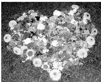
Viena no Ziedu dienas rotām – «Sirds no sirds».