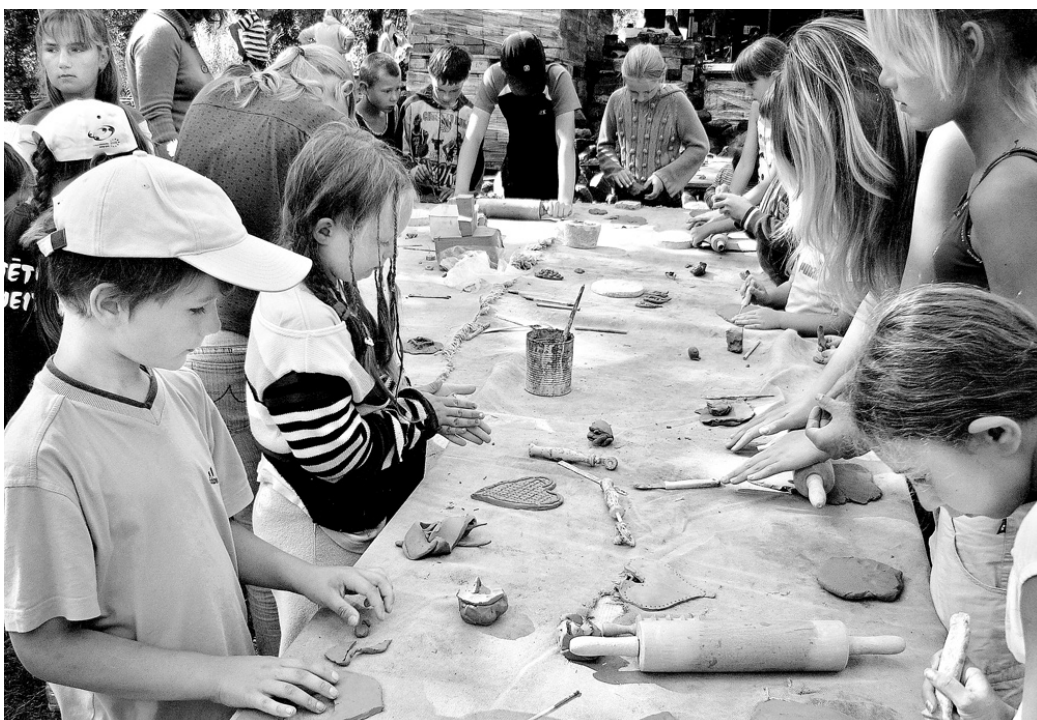
Darbošanās ar mālu aizrāva gan bērnus, gan pieaugušos.

Ģimenēm bija iespēja doties braucienā ar laivām pa Bārtas upi.