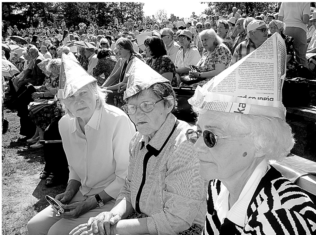
Lai paglābtos no karstās saules, salidojuma dalībnieki lika lietā izdomu un pagatavoja cepurītes no avīzēm. Ātri, ērti un izdevīgi!

Visvairāk uzrunāja Latvijas Ordeņu brālības valdes priekšsēdētāja Jāņa Rožkalna teiktais: «Pēdējo gadu laikā mērķtiecīgi sagrauts godaprāts, tikums un morāle. Latvijas valsts bagātības ir izlaupītas un izpārdotas. Valdošie par valsti saka «šī valsts», nevis «mūsu valsts»! Lai ko mainītu, jāatgriežas pie pārbaudītām konservatīvām vērtībām – morālas uzvedības izpratnes, ģimenes, ticības un godaprāta.»