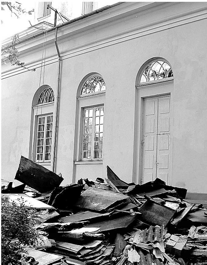
Šovasar Vecumnieku baznīcas vecais jumts tika noņemts, un tā vietā uzlikts jauns segums.

Darbu veikšanai konkursa kārtībā no sešiem pretendentiem tika izvēlēta firma «Konoss», kas veica vecā jumta seguma demontāžu un jaunā klājuma uzlikšanu. Protams, ka bija arī dažādi papildu darbi, piemēram, seguma izlīdzināšana, notekcauruļu pārmontēšana un vēl simt citu sīkumu. Bet nu ir laiks atskatīties par iztērēto naudu un lūgt vēl nedaudz atbal-