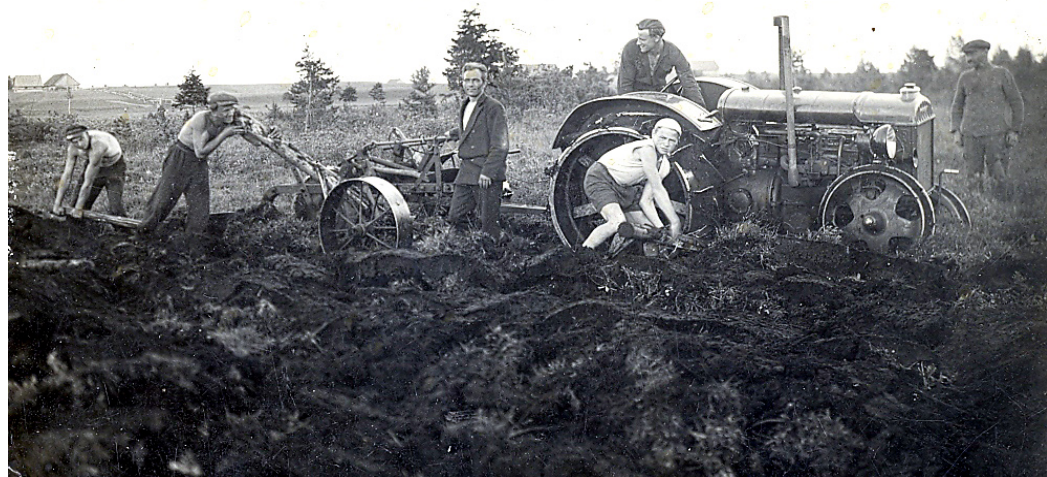
Rit zemes iekopšanas darbi Katrīnas purvā. Uzņēmums tapis 1938. gada 5. jūlijā.

Adrese: Rīgas iela 29, Vecumnieki, Vecumnieku pagasts, Vecumnieku novads, LV-3933, norāde – rubrikai «Laiku lokos»; e-pasts: <zanna.zalite@gmail.com>. Noteikti uzrakstiet arī savu vārdu, uzvārdu, ad-