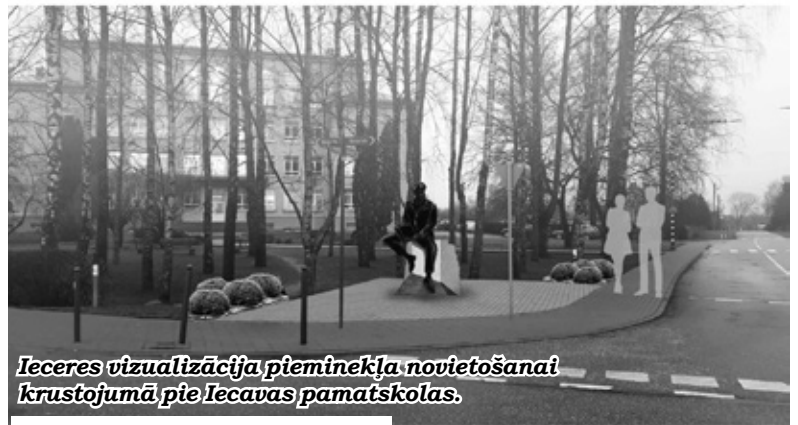
Ieceres vizualizācija pieminēklā novietošanai krustojumā pie Iecavas pamatskolas.

Kļūstot par pilsētu, Iecavā jāvairojas laikmetīgiem kultūras objektiem. Vides objekts bagātinās Iecavas sabiedrisko un kultūrvidi, kā arī tiks radīta simboliska vieta valstiskās piederības stiprināšanai, kur iecavniekiem un viesiem pulcēties Valsts svētku svinībām, Zinību dienā un izlaidumos, uzskata idejas virzītāji.