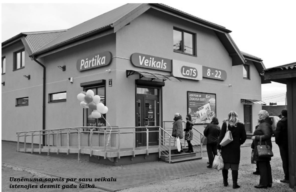
Uzņēmuma sapnis par savu veikalu istenojies desmit gadu laikā.