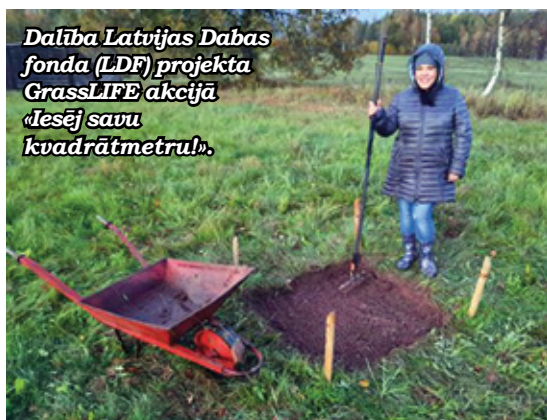
Dalība Latvijas Dabas fonda (LDF) projekta GrassLIFE akcijā «Iesēj savu kvadrātmetru!».

Latvijas ekoskolas ik gadu piedalās nedēļu ilgā starptautiskā kampaņā ar mērķi uzrunāt sabiedrību, vērst uzmanību nozīmīgām vides problēmām un ikvienu rosināt uz rīcību, kas var palīdzēt šīs problēmas mazināt. Nedēļas laikā tiek organizēti dažādi izglītojoši un interaktīvi pasākumi, kuru mērķis ir piedāvāt risinājumus, kā iespējams iesaistīties globālās problēmas risināšanā ar vietēja mēroga rīcībām.