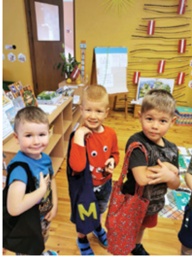
F: no PII «Dartija» albuma