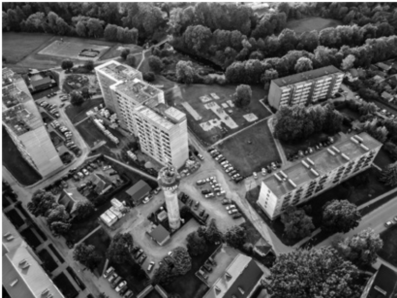
Skats uz Iecavu no putna lidojuma.

iemācīties vairāk par cilvēku fotografēšanu, jo gadās, ka paziņas vai radi pierunā pabildēt kādā pasākumā vai vēlas fotosesiju, un tad jāzina, kādu rakursu vai gaismas leņķi labāk izmantot.