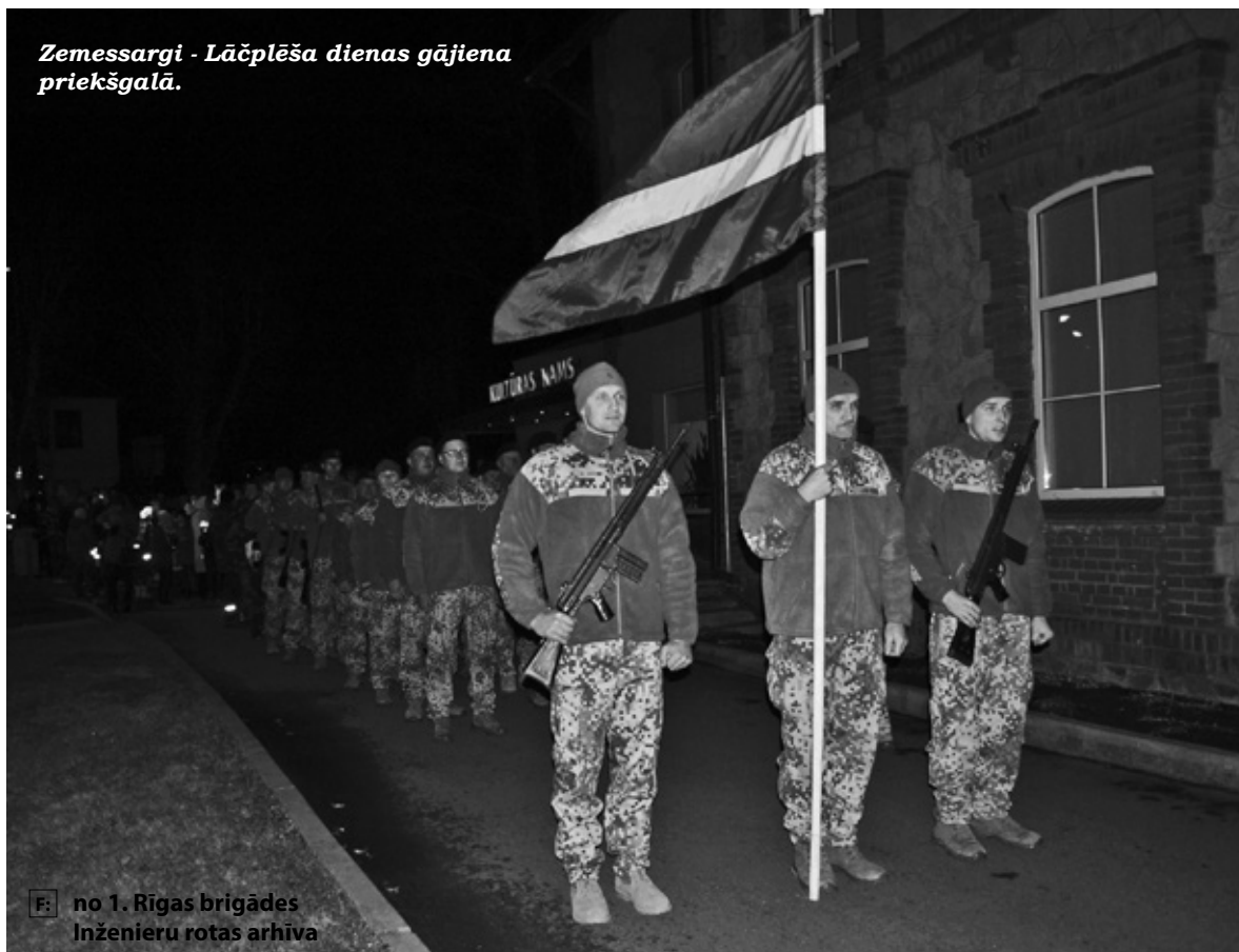
F. no 1. Rīgas brigādes Inženieru rotas arhīva

Zemessargi - Lāčplēša dienas gājiena priekšgalā.