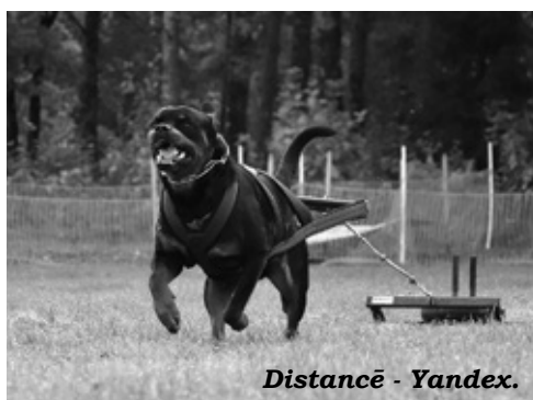
Distancē - Yandex.

distancē 3. vietu izcīnīja Ralfs Korņejevs ar rotveileru Solo; grupā Jaunietes (13-18 gadi) 2,2 km distancē uz pjedestāla kāpa divas iecavnieces, kuras trasē cīnījās par uzvaru ar vienu suni - pointeru Nessy. 1. vietu ieguva Amanda Hilda Gromova, bet 3. vietu - Kate