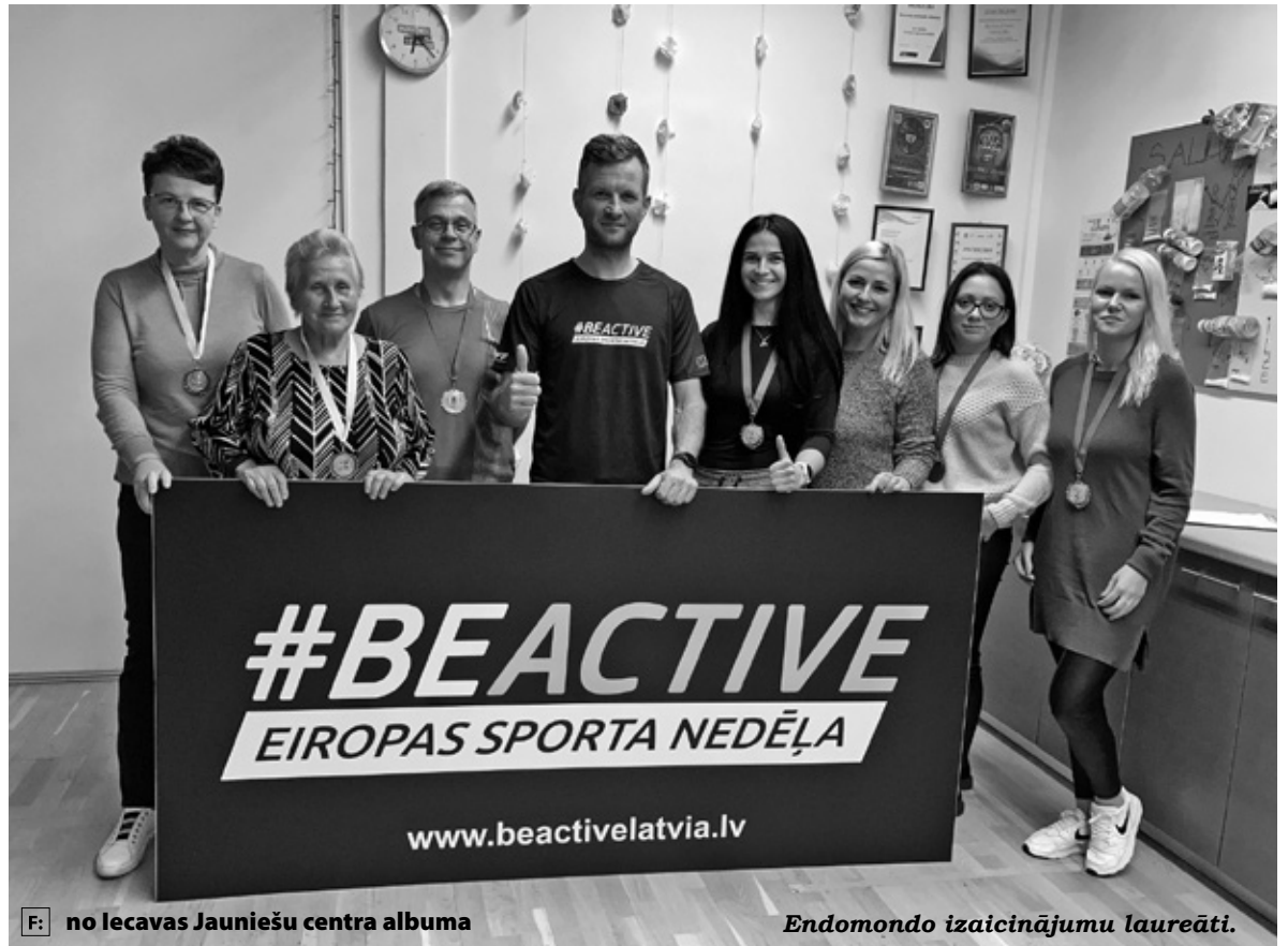
F: no Iecavas Jauniešu centra albuma

Nedēļas laikā Iecavas novadā kopā tika pieveikti 3420 km, pārvietojoties gan ar velosipēdu, gan kājām. Piektdien, 2. oktobrī, plkst. 18.10 Iecavas Jauniešu centrā tikās izaicinājumu aktīvākie kilometru krājēji katrā no disciplinām. Liela daļa dalībnieku ir