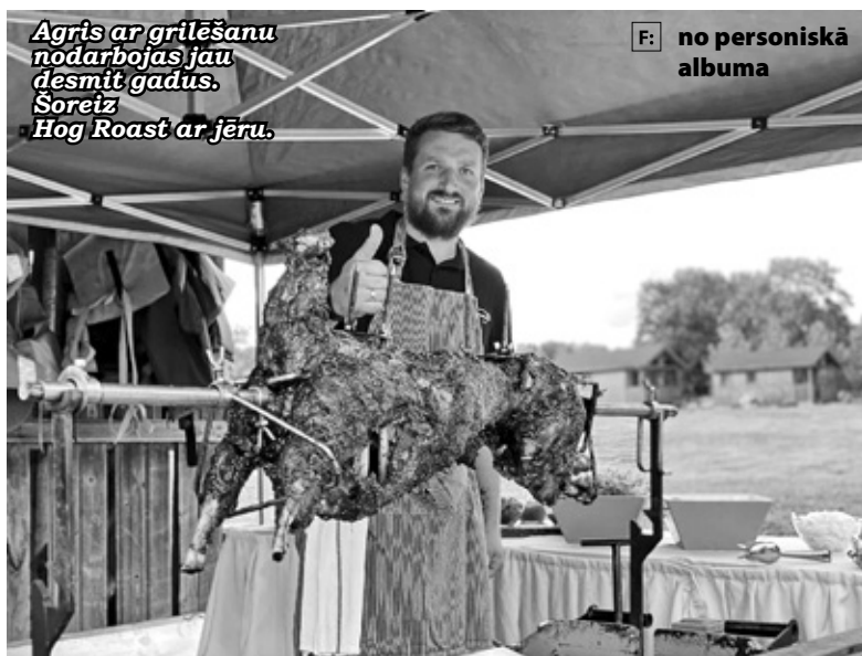
Agris ar grilēšanu nodarbojas jau desmit gadus. Šoreiz Hog Roast ar jēru.