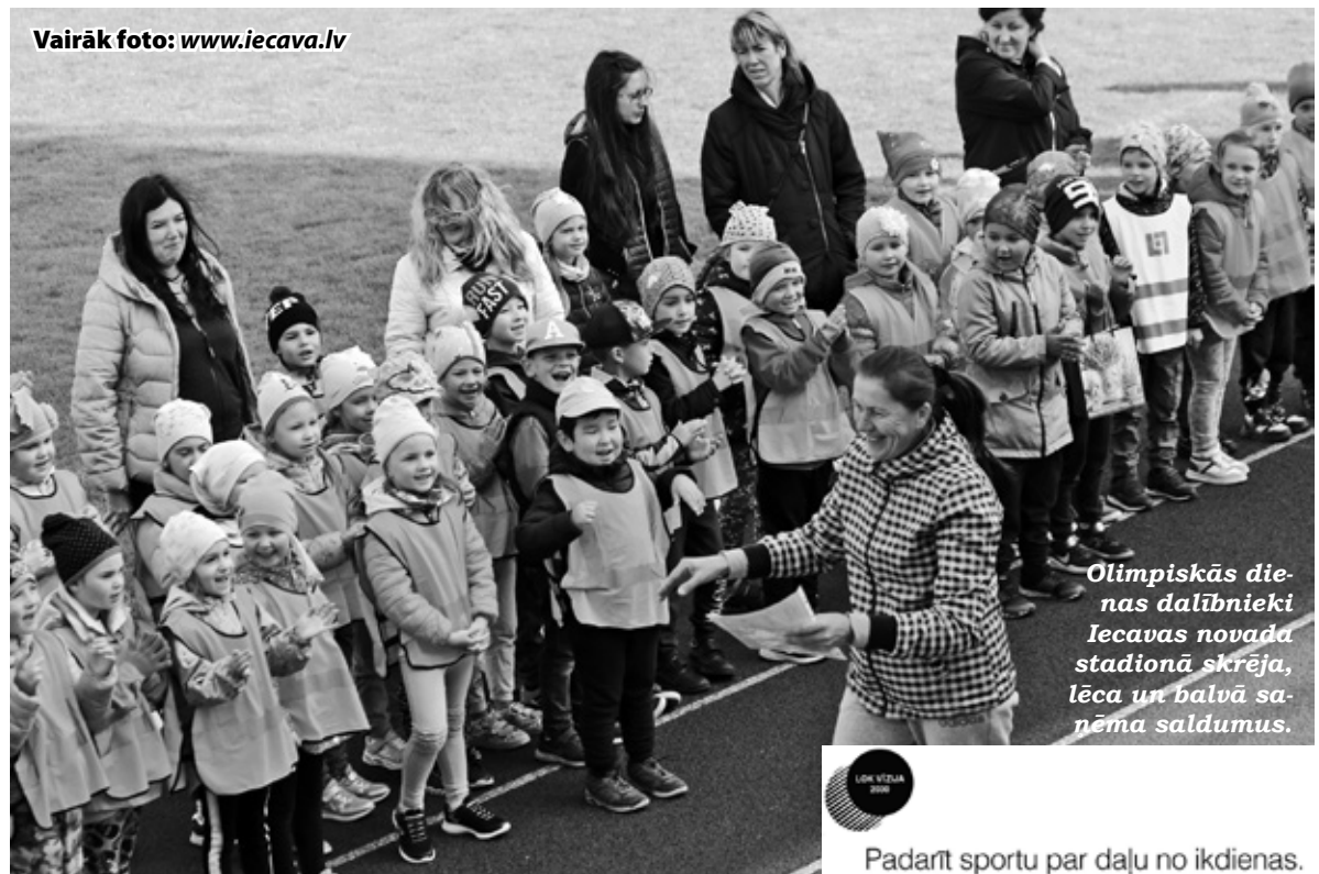
Vairāk foto: www.iecava.lv

3) iedrošināt tiekties uz izcilību, sekojot olimpiskajām vērtībām – turpināt un veicināt programmu «Sporto