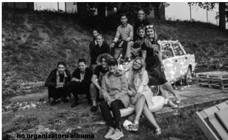
F: no organizatoru albuma