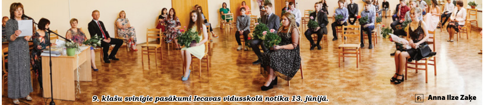
9. klašu svinīgie pasākumi Iecavas vidusskolā notika 13. jūnijā.