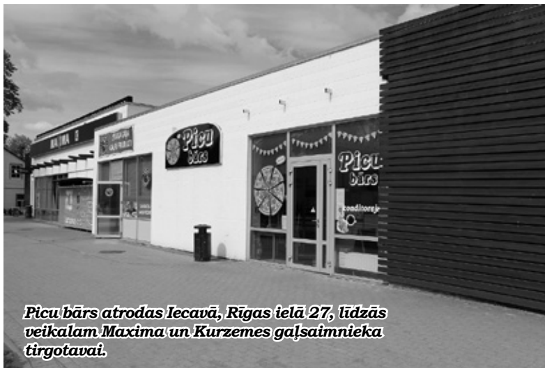
Picu bārs atrodas Iecavā, Rīgas ielā 27, līdzās veikalam Maxima un Kurzemes gaļsaimeņa tirgotavai.

Pagaidām vislielākais noiets esot picām. Un pircējiem tiešām ir, no kā izvēlēties: piedāvājumā ir