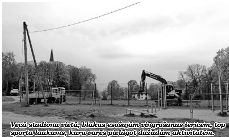
Vecā stadiona vietā, blakus esošajām vingrošanas terīcēm, top sporta laukums, kuru varēs pielāgot dažādām aktivitātēm.

Līgums par darbu veikšanu ir noslēgts ar uzņēmumu SIA «STRABAG» par līgumcenu 55 720,33 eiro (ar PVN). Projekta publiskais finansējums (ELFLA) ir 22 500 eiro, pašvaldības līdzfinansējums - 33 220,33 eiro. [Z]