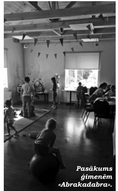
Pasākums ģimeņiem «Abrakadabra».