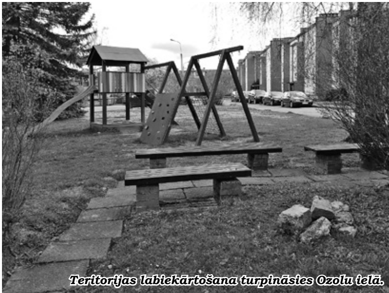
Teritorijas labiekārtošana turpināsies Ozolu ielā.