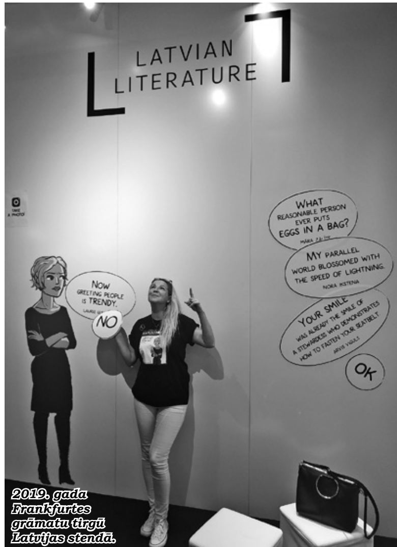
2019. gada Frankfurtes grāmatu tīrgū Latvijas stendā.

Pēc tam nāca milzīgs pagrieziens manā profesionālajā karjerā. Izturot lielu konkursu, sāku strādāt Latvijas vēstniecībā Londonā, koordinējot Latvijas dalību Eiropas Savienības Padomē, 2015. gadā Latvijai kļūstot par