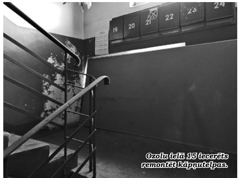
Ozolu ielā 15 tēcerēts remontēt kāpņutelpas.

Edvarta Virzas ielas 2B garāžu kolektīvs šogad īsteno projektus «Piebraucamās zonas sakārtošana». Konkursa pieteikumā minēts, ka pie iebrauktuves garāžu teritorijā ir izveidojusies liela bedre, kurā spēcīga lietus laikā sakrājas ūdens. Šī iemesla dēļ ir traucēta gan gājēju, gan automašīnu piekļūšana garāžām. Tāpat teritorijā ir liela papele, kuru nepieciešams nozāģēt. Ņemot vērā,