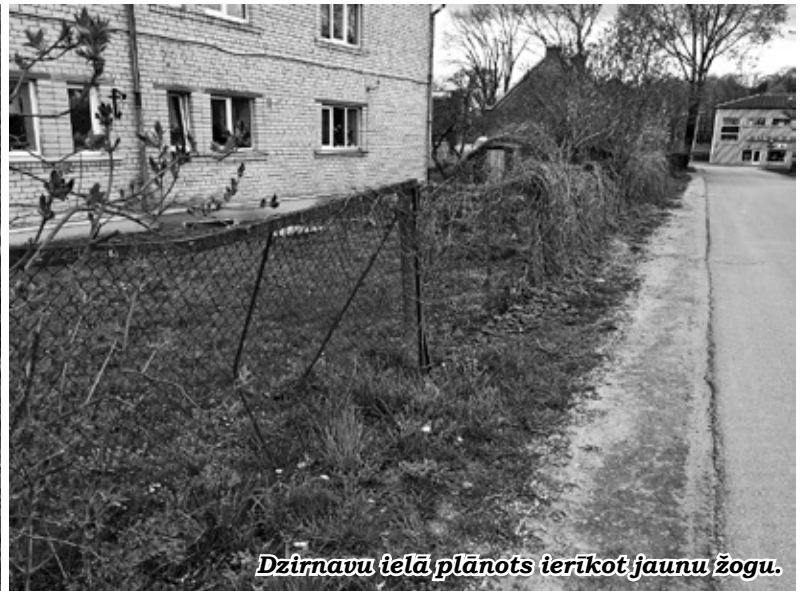
Dzirnavu ielā plānots ierīkot jaunu žogu.

sabiedrisko attiecību speciāliste