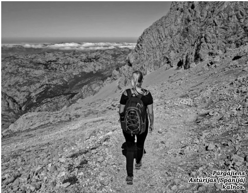
Pārgājiens Astūrijas (Spānijā) kalnos.

- Iecava vienmēr būs sava veida mājas, jo Iecavā joprojām dzīvo mamma. Turklāt visas bērnības un skolas laiku draudzenes ir Iecavnieces. Lai arī kurā pilsētā