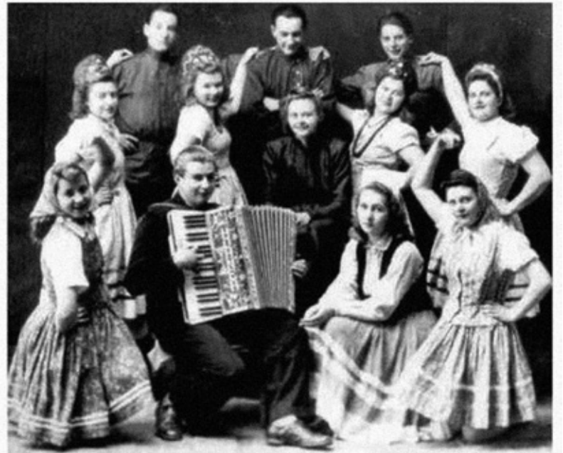
Iecavas tautas nama deju kolektīvs 1949. gadā.