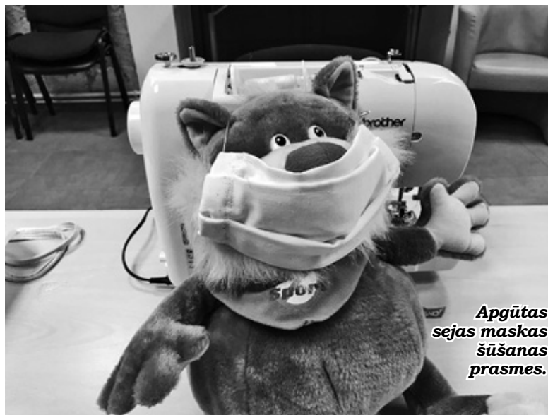
Apgūtas sejas maskas šūšanas prasmes.

Esiet kustīgi - arī es to daru, lai «nepaliek stīvi kauli». Zinu, ka