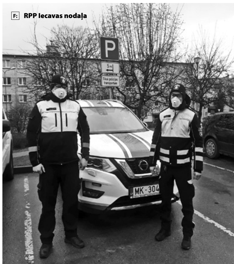
F: RPP Iecavas nodaļa

Svarīgāka par ierobežojumu formālu ievērošanu ir cilvēku saprātne