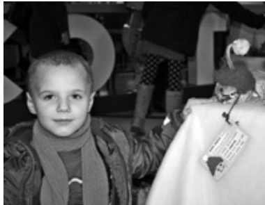
Dans Dricka konkursa «Mans Zaļais dāvanu iesaiņojums» izstādes atklāšanā.

Koks bija priecīgs, jo uzlija lietutiņš. Viņš padzērās, bet bija nesmuks ar atkritumiem. Kad plastmasa ir uz galvas, tad nevar paelpot. Kokam bija sliktā dūša. Viņš nevarēja arī zarus pakustināt. Ķūķa grupas bērni gāja uz parku pastaigāties un paņēma līdzī rokas knābi (tā bērni nosauca sētnieku knaibles atkritumu savākšanai). Pēkšņi viņi ieraudzīja, ka vienam kokam, ozolam, bija viss ar plastmasas mēsliem samētāts. Un zāle arī bija netīra, ziedus nevarēja redzēt. Viņi paņēma roku knābi un cimdus un salasīja atkritumus no koka, zāles un puķēm nost. Viņi tos atkritumus salika dzeltenajā konteinerā. Kad