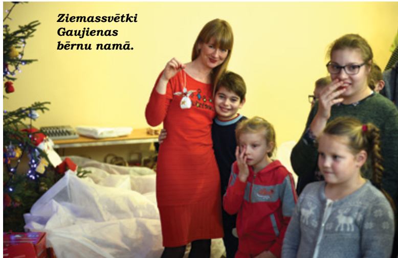
Ziemassvētki Gaujienas bērnu namā.