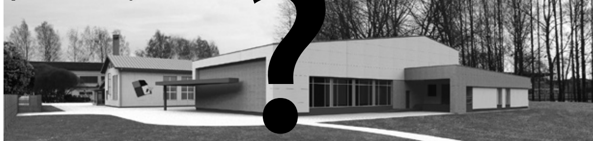
Projektētās Iecavas vidusskolas piebūves vizualizācija.

Ir izstrādāts Iecavas vidusskolas piebūves projekts, un lai īstenotu skolas pārbūvi, pašvaldība bija plānojusi ņemt aizņēmumu Valsts kasē. Taču, šādi virzot ATR, pašvaldībai ir liegta iespēja saņemt aizdevumu, tādējādi projekta nākotne nav skaidra.