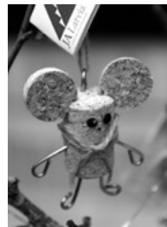
Ķekavas vidusskolas SMU «CorkSio» ražotais dekorpelīte.

Visi SMU tika vērtēti divās vecuma grupās - pamatskolu grupā un vidusskolu grupā. Nominācija « Sociāli atbildīgs skolēnu mācību uzņēmums » pamatskolu grupā netika piešķirta, bet vidusskolu grupā to saņēma SMU «Waxtile» no Mārupes Valsts ģimnāzijas, kas ražo bišu vaska kokvilnas audumus produktu uzglabāšanai. Nominācijā « Labākais skolēnu mācību uzņēmuma stends » laurus plūca SMU «Bišķiņ prieka» no Īslīces pamatskolas,