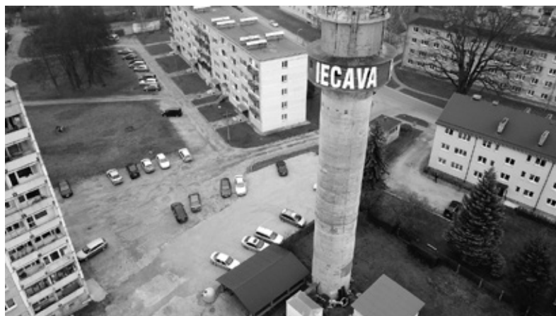
Laukums ar šķembu segumu ierīkots blakus ūdenstornim.