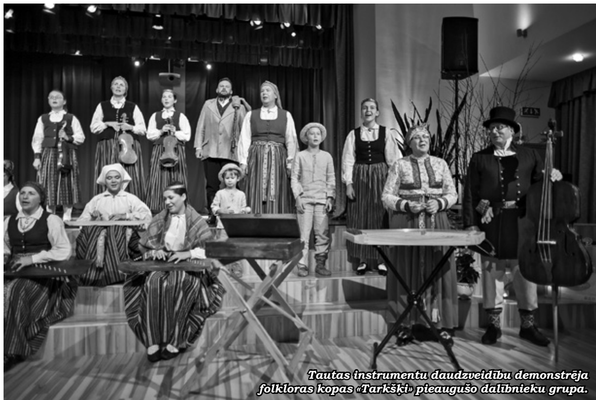
Tautas instrumentu daudzveidību demonstrēja folkloras kopas «Tarkšķi» pieaugušo dalībnieku grupa.

Man ir ļoti ļoti kaimiņi atbalstītāji, kas šovasar pat savus draugus pieaicināja palīdzēt. Tikām arī pie