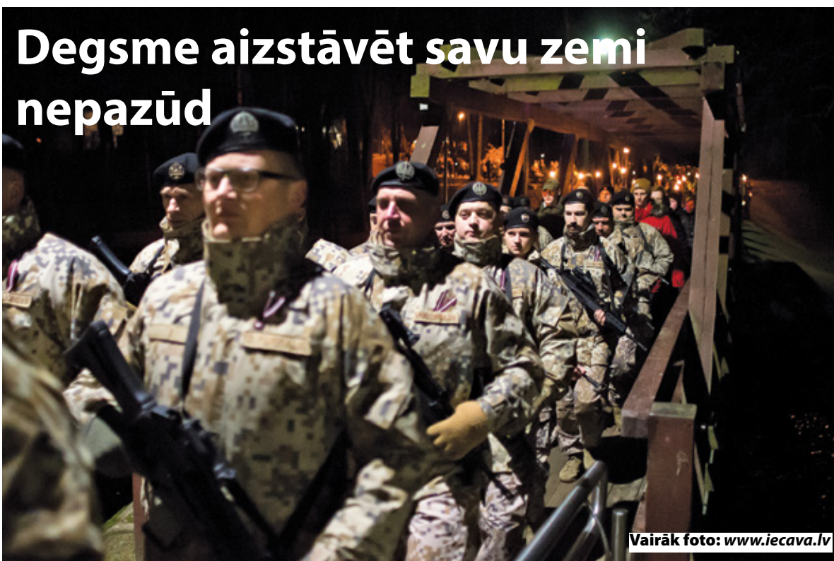
Vairāk foto: www.iecava.lv